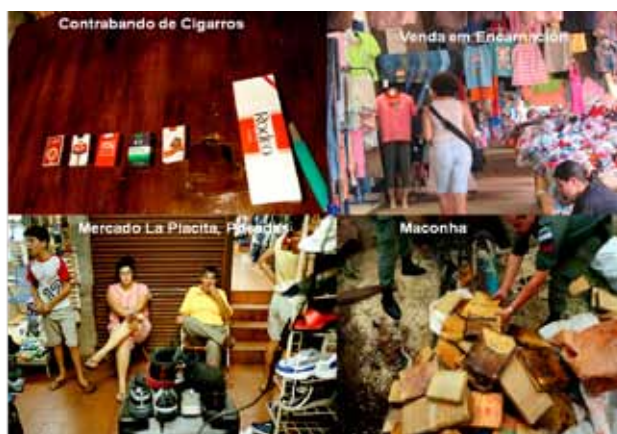
FIGURA 3. O QUE SE PASSA. FOTOS GIANCARLO CERAUDO E BRÍGIDA RENOLDI

A fronteira argentino-paraguaia é propícia à circulação de mercadorias variadas: legais, como roupas, eletrônicos, CDs, cigarros, frutas; e ilegais, dentre as quais a maconha é o expoente mais visível (Figura 3).