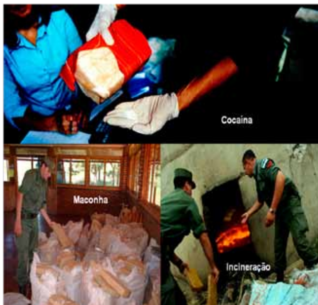
FIGURA 4. Os controles rotineiros no noroeste têm propiciado mudanças nas rotas e, nos últimos anos, há registros policiais de circulação de cocaína pela fronteira com o Paraguai, disfarçada em diversos modus operandi , tradicionalmente atípicos na região.

Tal deslocamento se viu favorecido pela pavimentação quase completa da estrada Transchaco – criada em 1960 pelas colônias menmonitas , 12 cuja população se fixou desde o início do século passado no Chaco Paraguai. A estrada conecta o oeste com o leste do Paraguai, projetando-se ainda para a Bolívia, com o propósito de facilitar os acessos entre o oceano Pacífico e o Atlântico, através das estradas já existentes, e assim favorecer os intercâmbios mercantis.