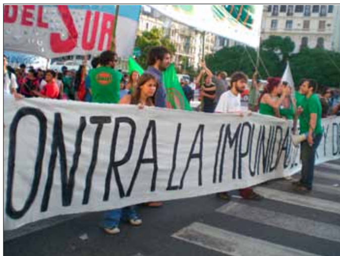
FIGURA 1- MARCHA DE LA MEMÓRIA: PASSEATA (2010) EM MEMÓRIA AO GOLPE DE ESTADO EM 24 DE MARÇO DE 1976

Ao iniciar o trabalho de campo sobre as práticas policiais prévias e simultâneas às atividades judiciais em casos de narcotráfico, entendi que aquele binômio teria de ser repensado, principalmente pela relação fundamental entre os dois termos e sua significação para o âmbito da justiça.