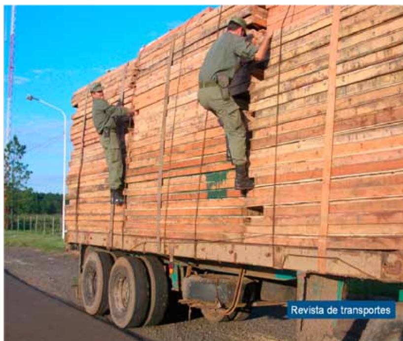
FIGURA 5. TRABALHO DE ROTINA

e se estendia aos batalhões que davam apoio técnico à investigação judiciária (Figura 6).