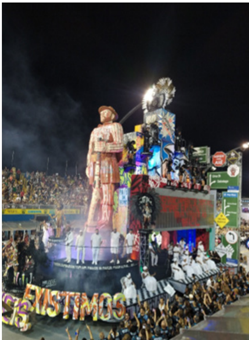
Fig. 4 - Quarta alegoria, Vai-Vai, 2024.

(trecho do samba-enredo da Escola de Samba Vai-Vai, 2024)