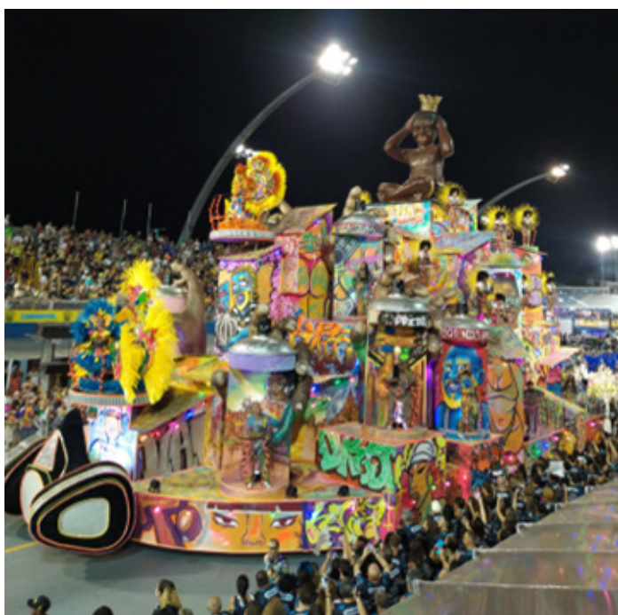
Fig. 3 - Terceira alegoria, Vai-Vai, 2024.

Saem as volutas, as sinuosas curvas esculpidas em isopor e acetado e entram as formas rígidas dos edifícios da cidade. Saem os acabamentos minuciosos de um “barroquismo carnavalesco” de tecidos e aviamentos caros e entra a tinta nua e crua. A verdade, assim, se dá na simplicidade... Cai por terra a soberba visual que tenta iludir através de acúmulos e brota, do asfalto, uma arte bruta, de sentidos e de discursos.