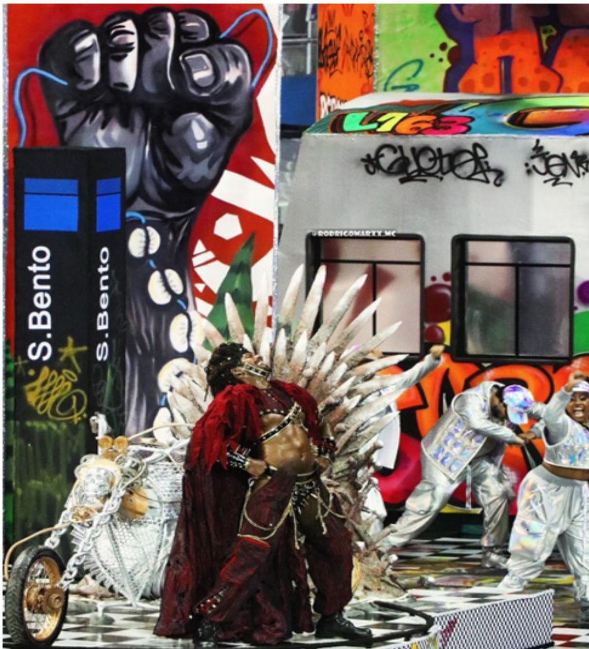
Fig. 1 - Comissão de frente, Vai-Vai, 2024.