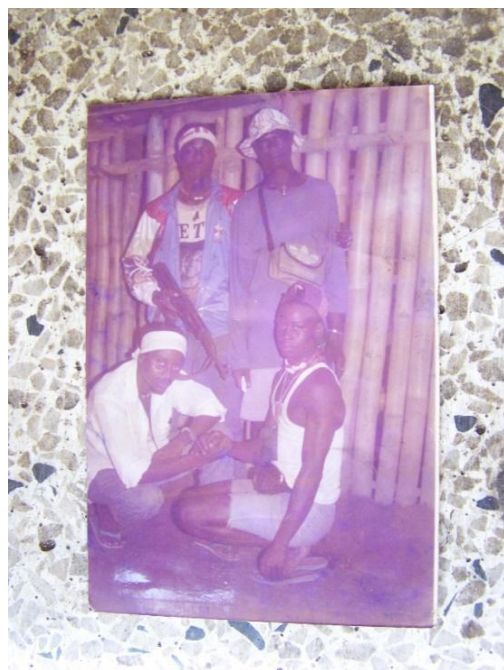
Figura 9. (Abajo-