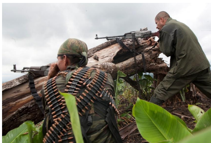
Figura 14. Por la nueva Colombia 6 en Combates. Fecha y lugar desconocidos.

Un contraste con estas fotografías se halla en el documento titulado “Muertos en combate”. Fechado en noviembre de 2003, reúne 23 retratos de mujeres y hombres con sus respectivos nombres. Los rostros de estas personas dan cuenta de la heterogeneidad de los militantes de la guerrilla, expresado en marcas etarias, de género y raciales, pero también en sus uniformes y en los lugares donde fueron tomadas, ya que los fondos parecen ser distintos entre sí (casas de madera, zonas boscosas y espacios abiertos). Puede que este tipo de documentos fueran el