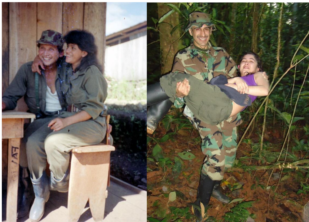
Figura 20 (Izquierda). Pareja 2 en Parejas. Fecha y lugar desconocidos. Figura 21 (Derecha). Pareja 34 en Parejas. Año 2010, lugar desconocido.

componente afectivo de sus relaciones, ya que son retratados alejados del combate, abrazados o bailando.