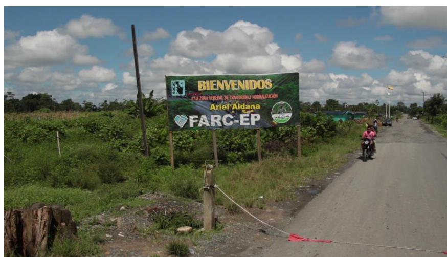
Figura 1. Fotografía de la ZV Ariel Aldana, Tumaco (Nariño) (La Direkta, 2017).

noviembre de 2017, habitaban 247 adultos y 40 niños (Oficina del Alto Comisionado para la Paz, 2018).