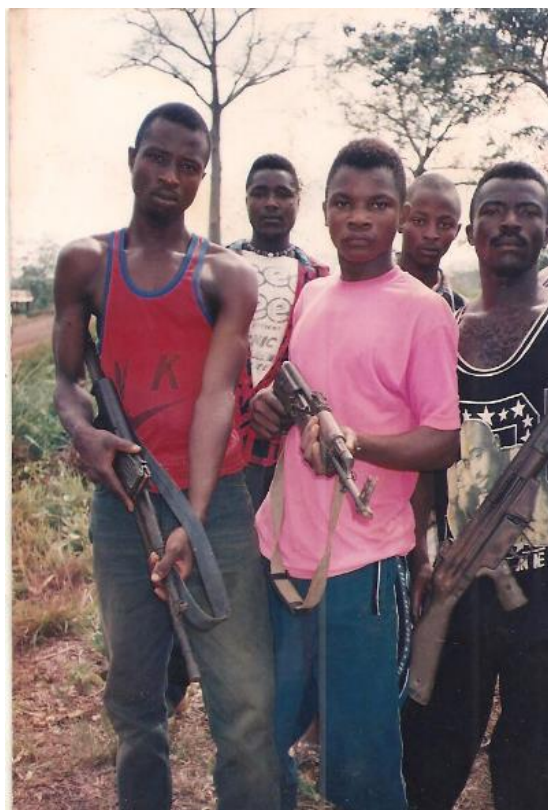
Figura 8. (Abajo-izquierda). Rebeldes del R.U.F. en su campo de entrenamiento en Zogoda.