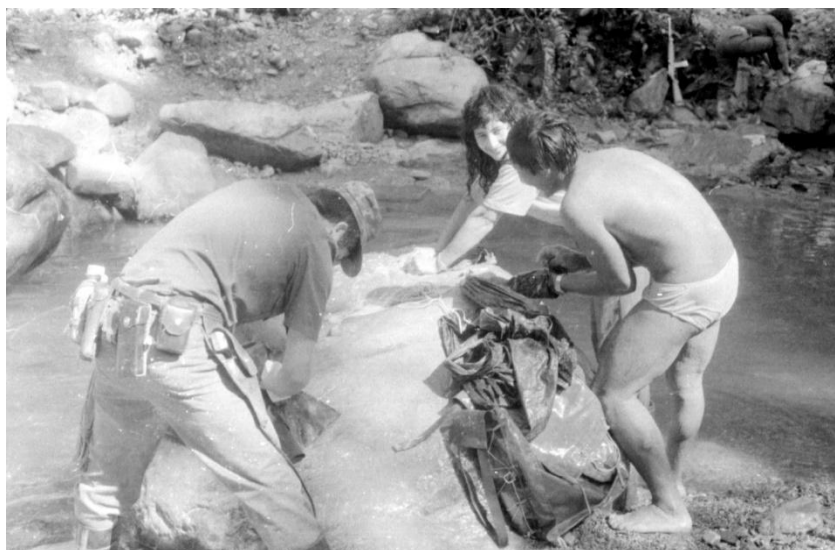
Figura 16. Guerrilleros lavando 8 en Guerrilleros en baño. Fecha desconocida, aunque probablemente años ochenta, lugar desconocido.