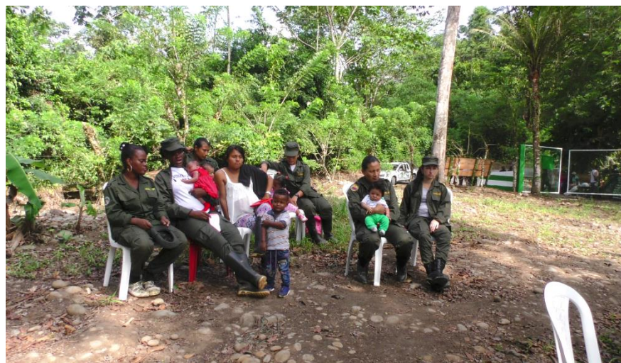
Figura 2. Exguerrilleras y exguerrilleros con sus familias (La Direkta, 2017).