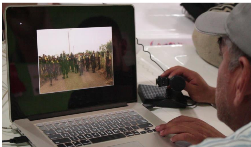
Figura 3. Ejercicio realizado en la oficina de comunicaciones de la Ariel Aldana. (La Direkta, 2017).