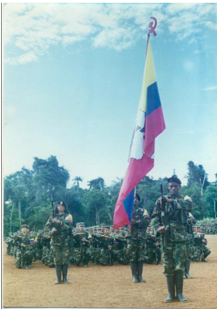
Figura 11. 37 marcha39 en 37 aniversario. 2001, lugar desconocido.

guerrillera de espaldas con una cámara con flash en sus manos, atenta a registrar algún detalle que surja en las filas guerrilleras.