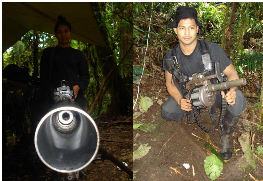
Figura 24 (izquierda). Guerrillera con punto 50 298 en Guerrilleras. 2007, lugar desconocido. Figura 25 (derecha). Guerrillero 368 en Guerrilleros. 2011, lugar desconocido.