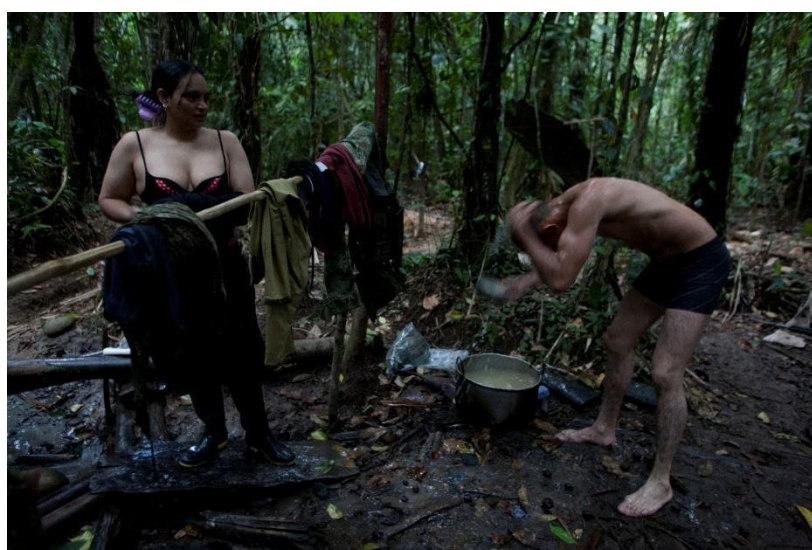
Figura 17. Guerrilleros cambiándose 34 en Guerrilleros en baño. 2011, lugar desconocido.