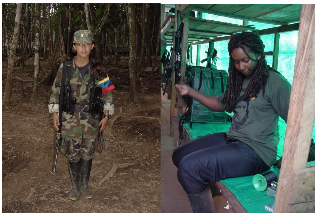
Figura 18 (Izquierda). Compañera Flco. 54 en Guerrilleras. Año 2004, lugar desconocido.

En el archivo fotográfico estudiado, las carpetas de Guerrilleros (630 imágenes) y Guerrilleras (895 imágenes) permiten ahondar en la diversidad de la militancia de las FARC, con sus marcas de género, raciales, etarias y rasgos distintivos personales. También develan los territorios ocupados por la guerrilla: selvas, manglares, páramos, campos abiertos y veras de los ríos. Las preguntas a formular aquí son: ¿Quién es un guerrillero o guerrillera? y ¿Cuál es el imaginario que tenemos sobre él o ella?.