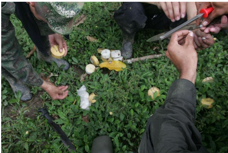
Figura 13. Minas 52 en Combates. Fecha y lugar desconocidos.

ametralladora. El otro, con su cuerpo envuelto en cuatro líneas de municiones, se protege detrás de un tronco y apunta con su fusil.