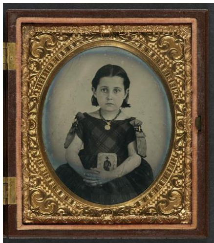
Figura 6. Niña anónima vestida de luto sosteniendo un retrato de su padre sosteniendo una espada (Digital a partir de ambrotipo. 1861-1865. Biblioteca del Congreso, Estados Unidos).