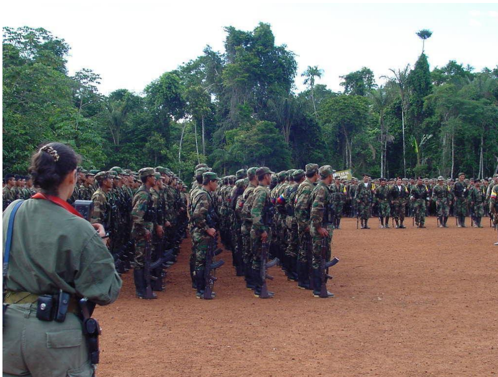
Figura 12. 37 pate 03 en 37 aniversario. 2001, lugar desconocido.