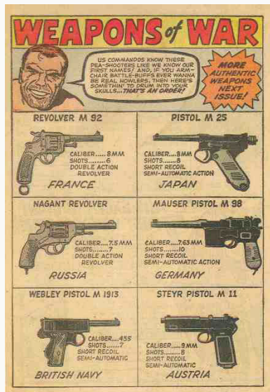
(Figuras 01 e 02) Sgt. Fury and his Howling Commandos nº 01 e 02 (Maio e Julho de 1963). Entre as histórias existia a apresentação de armas que apareciam nas narrativas.

O efeito de realidade pretendido pelos roteiristas era produzido nas narrativas através de cenas com pelotões de fuzilamento; aparição de Adolf Hitler; e até mesmo a morte de personagens principais do Comando Selvagem , o que não era comum nos quadrinhos nessa época. A mensagem era de que a guerra era cruel, com perdas para ambos os lados.