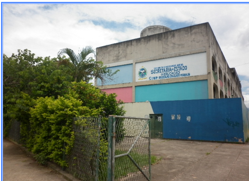
Figura 1: Vista frontal da Unidade Escolar.