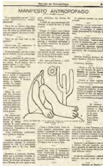
(Manifesto Antropófago, publicado na edição nº 1 da Revista de Antropofagia - São Paulo -, em maio de 1928, tendo como ilustração o desenho "Apaburu", de Tarsila do Amaral)

Só a antropofagia nos une. Socialmente. Economicamente. Filosoficamente.