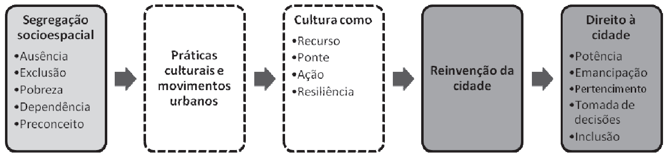
Figura 1 – Da segregação socioespacial ao Direito à Cidade