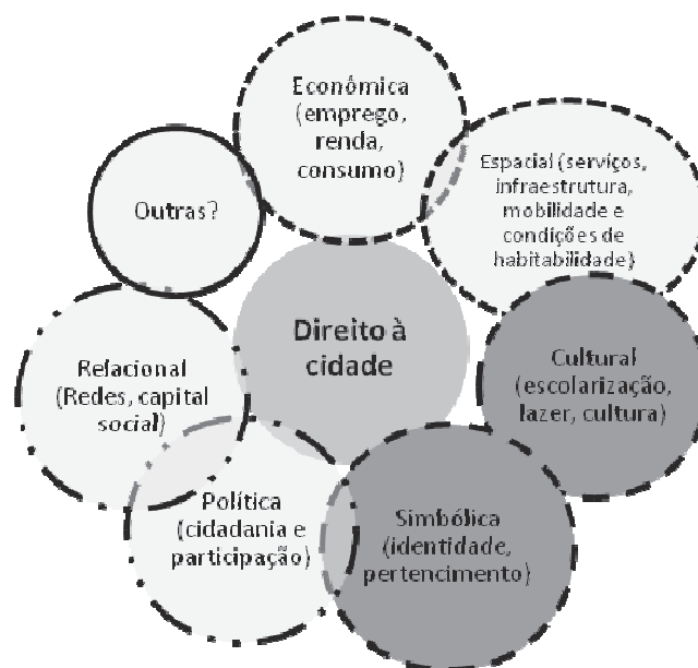
Figura 2 – Dimensões possíveis do Direito à Cidade

Entende-se que a dimensão cultural é fator indispensável para o enfrentamento da segregação socioespacial e para a efetivação do Direito à Cidade. Ademais, tal dimensão incorpora e se mescla com várias outras, especialmente com a simbólica, a relacional e a dimensão política do Direito à Cidade, assumindo, portanto, sua centralidade definitiva para a mudança da posição dos moradores das periferias na cidade.