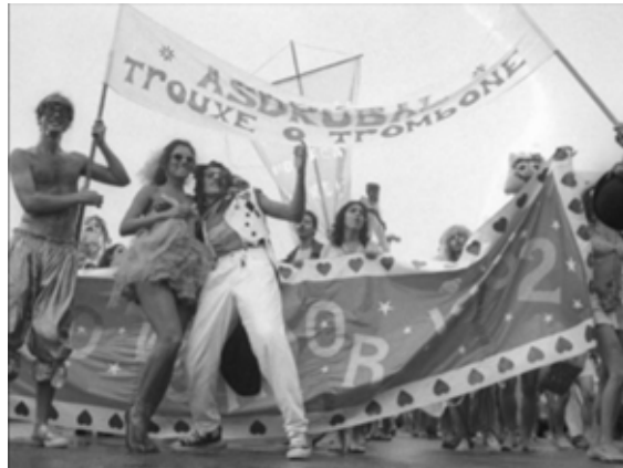
Figura 1 – O desfile da Suprendamental Parada Voadora

(Silveira, 2015)