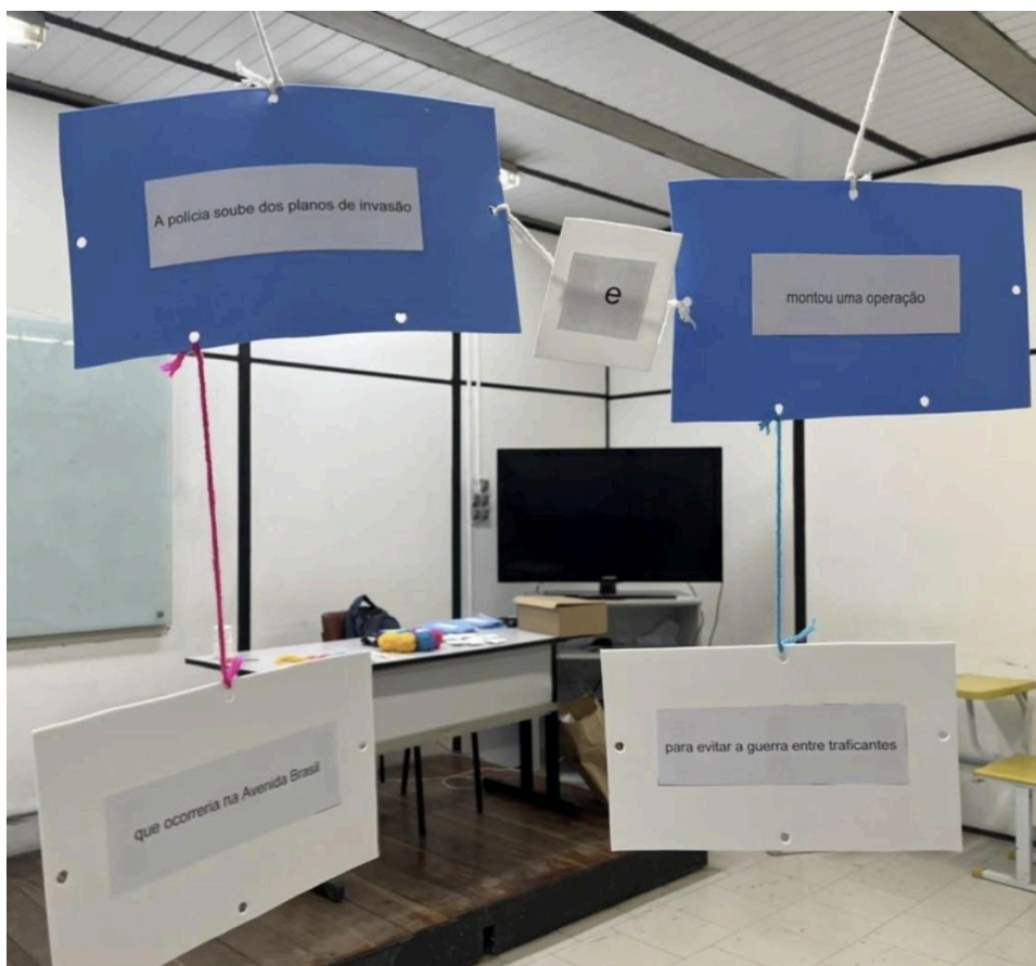
Figura 2 - Montagem de sentença no Varal do Período Composto.

Na Figura 2, há 2 orações coordenadas entre si, as quais são representadas por um barbante branco em posição horizontal. Além disso, dois elementos também foram concretizados em forma de plaquinhas. A conjunção “e”, presente na Figura 2, e a vírgula, presente na Figura 3 a seguir, foram materializadas em uma plaquinha de EVA menor, com um pregador preso em seu verso. A conjunção “e” deveria ser presa nos barbantes que indicassem coordenação, enquanto a vírgula deveria ser presa nos barbantes que indicassem orações relativas apositivas.