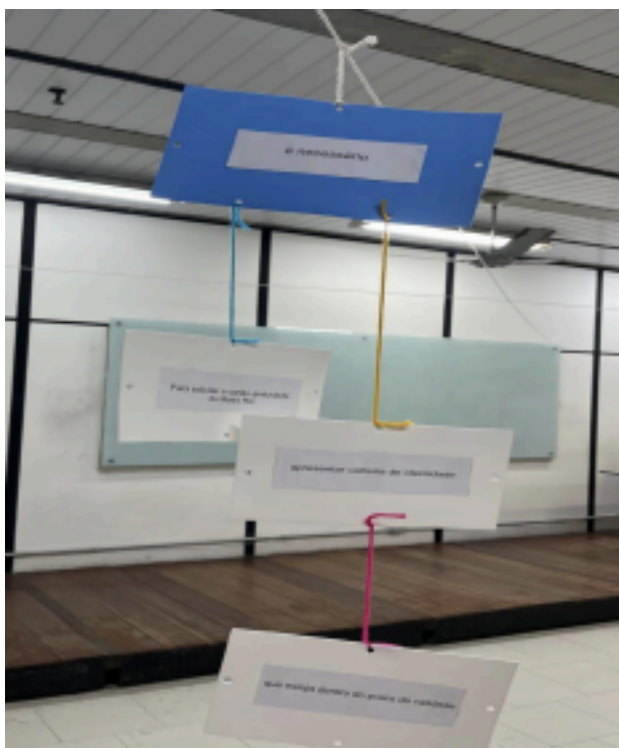
Figura 1 - Montagem de sentença no Varal do Período Composto.

(3) a. Há uma oração matriz, à qual estão subordinadas uma oração adverbial e uma oração completiva com função de sujeito. A oração completiva apresenta uma oração relativa com função de adjunto adnominal subordinada a ela.