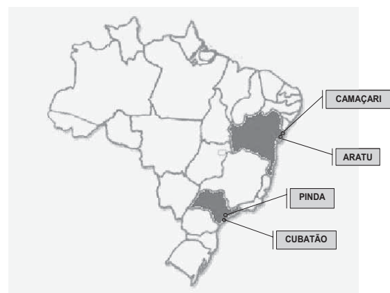
Figura 1: Localização dos Envolvidos no Processo de Transporte

Uma das características do processo é que todos os produtos envolvidos são entregues diariamente, e possuem características, dimensões, formas de carregamento, descarregamento e armazenagem diferentes.