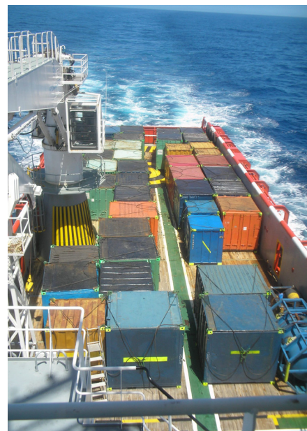
Figura 3 - Embarcação carregada

Tais embarcações transportam em seu convés cargas e equipamentos necessários para o suprimento de unidades marítimas, assim como observado na figura 3.