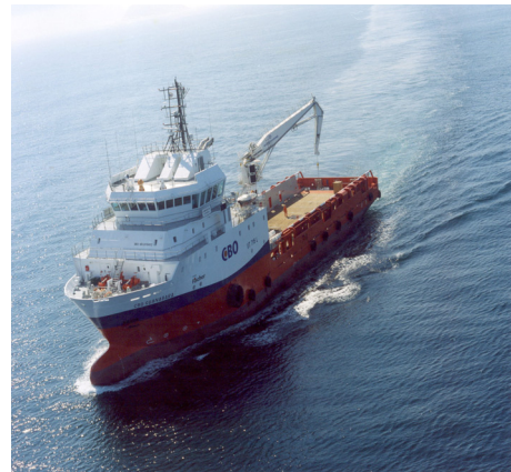
Figura 2 - Embarcação tipo PSV

necessárias sete variáveis para descrever a modelagem do processo licitatório, com enfoque em embarcações do tipo PSV (PLATFORM SUPPLY VESSEL), similares à embarcação da figura 2.