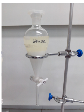
Figura 4 – Primeira lavagem

A primeira lavagem foi feita com uma água levemente acidificada com HCl para neutralizar o catalisador básico, bem como retirar o excesso de álcool da fase éster. Nessa etapa, notou-se que na fase aquosa (mais densa) houve a formação de sabão, devido, possivelmente, ao óleo que não reagiu, conforme ilustrado na Figura 4. Neste caso, a ocorrência da reação de saponificação mostra-se interessante para retirar o óleo que ainda não havia reagido, ficando na fase éster essencialmente o biodiesel. No caso de saponificação a corrida não foi considerada adequada para produção do biodiesel.