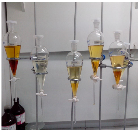
Figura 3 – Separação de fases glicerol-éster de canola, coco, girassol, milho e soja

A primeira lavagem foi feita com uma água levemente acidificada com HCl para neutralizar o catalisador básico, bem como retirar o excesso de álcool da fase éster. Nessa etapa, notou-se que na fase aquosa (mais densa) houve a formação de sabão, devido, possivelmente, ao óleo que não reagiu, conforme ilustrado na Figura 4. Neste caso, a ocorrência da reação de saponificação mostra-se interessante para retirar o óleo que ainda não havia reagido, ficando na fase éster essencialmente o biodiesel. No caso de saponificação a corrida não foi considerada adequada para produção do biodiesel.