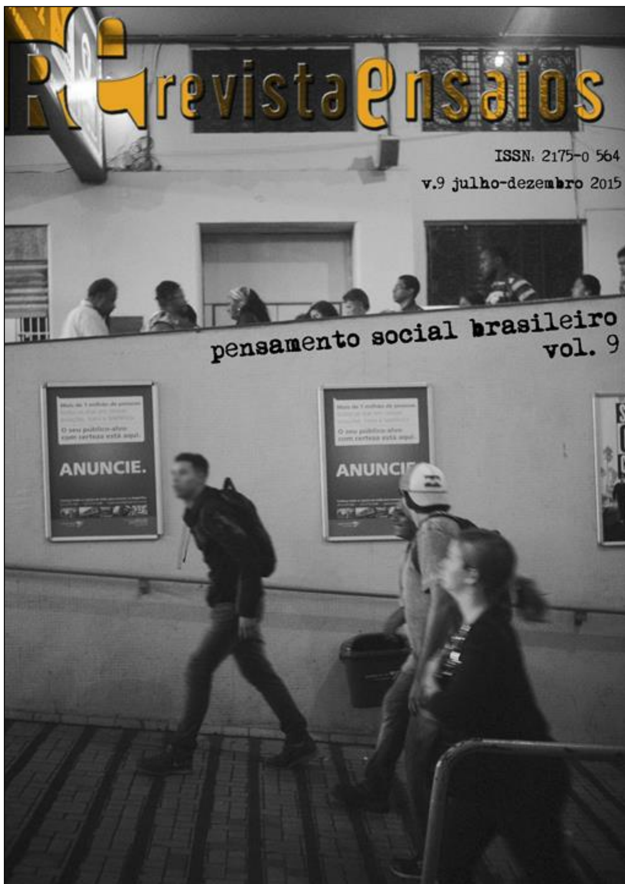
V. 9: Pensamento Social Brasileiro - 2015 Foto de capa: Série "De passagem na mão", de Yan Braz Diagramação: Quézia Lopes