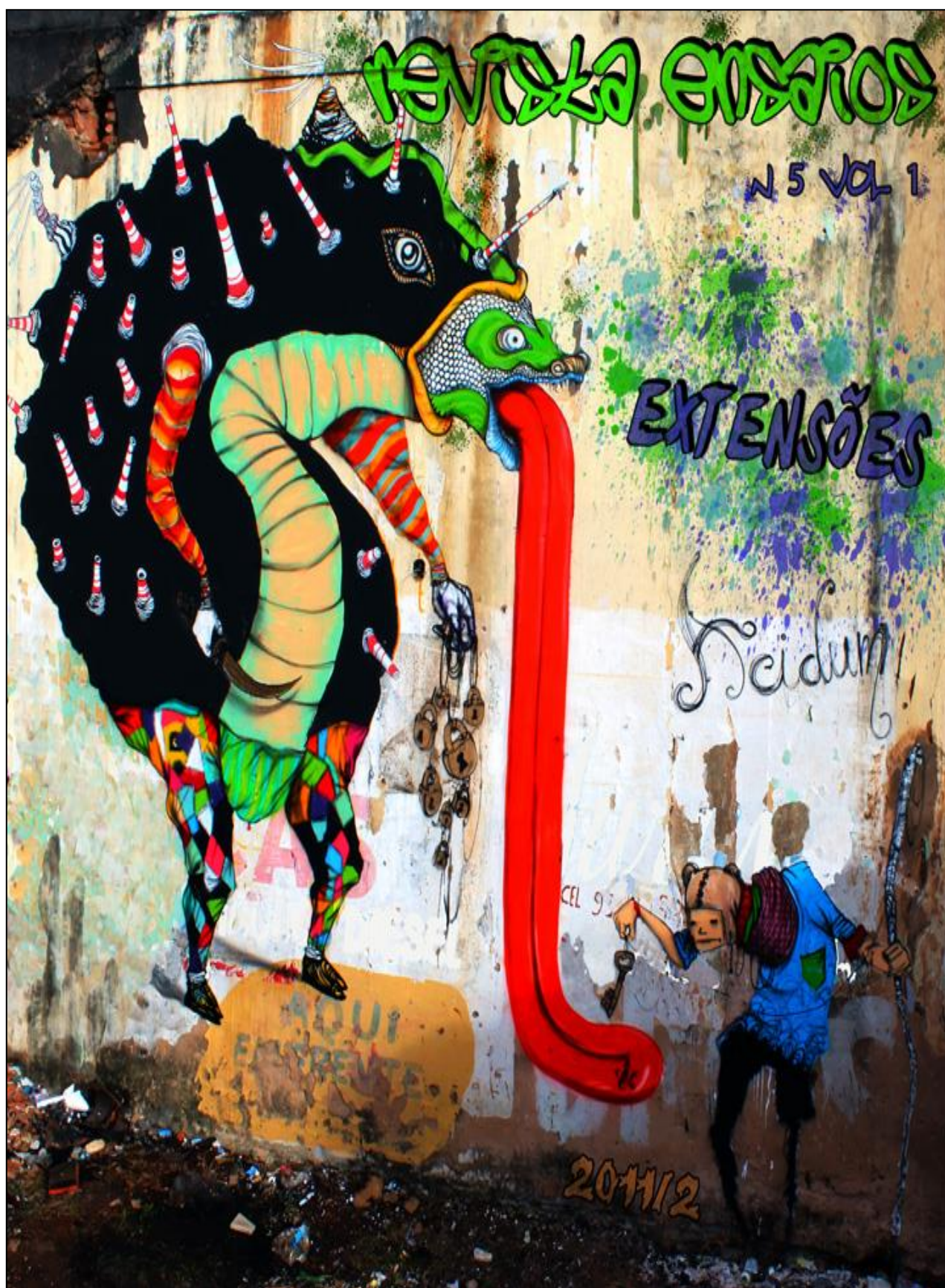
V. 1, n. 5: Extensões - 2011 Título: Sem título Autor: Acidum Edição Digital: Philippe Costa