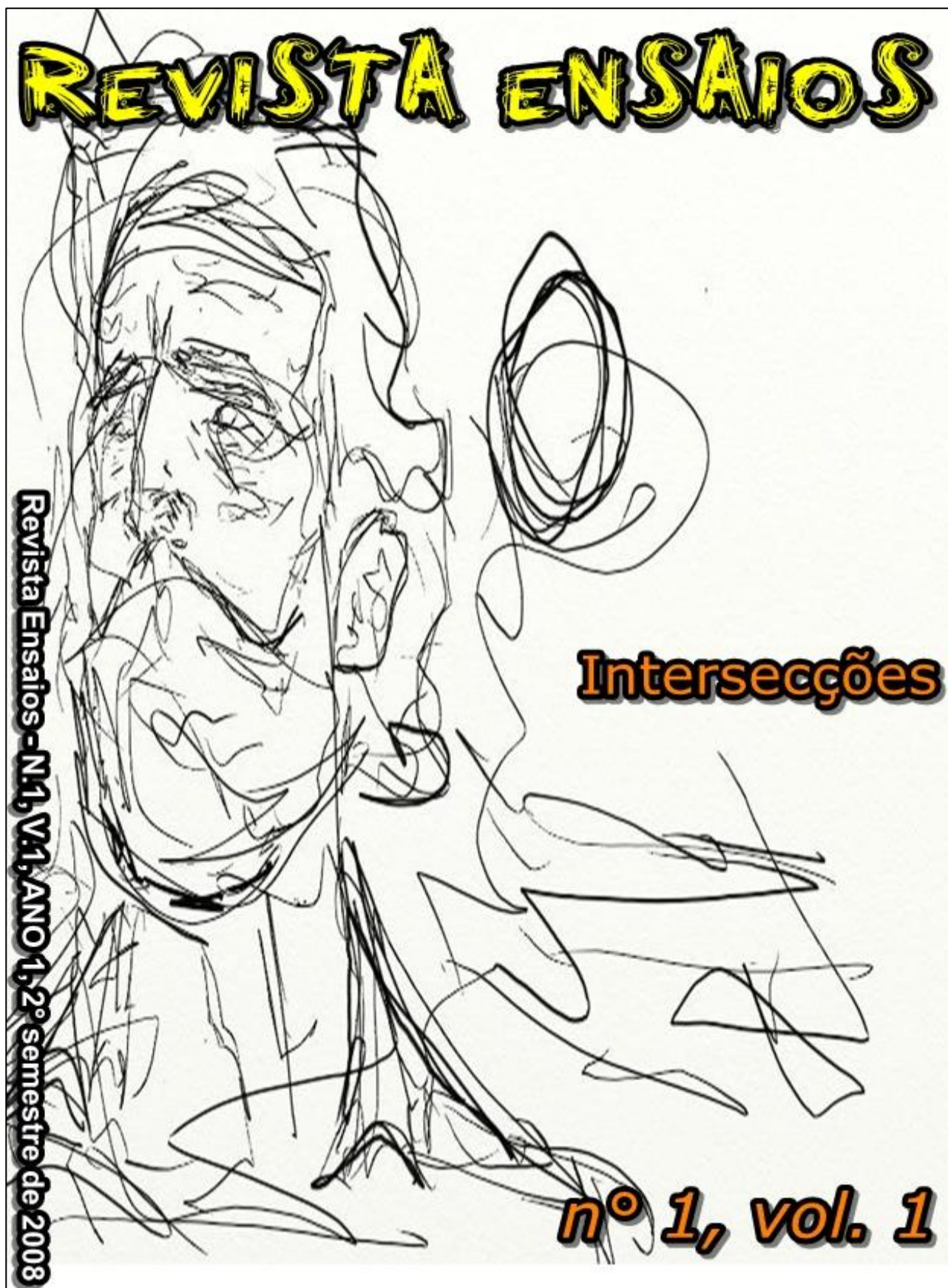
Capa da primeira edição da Revista Ensaios nº 1, vol.1, Intersecções , 2008 Título: O ilustre desconhecido Autor: Renan Prestes