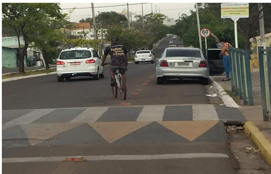
Figura 3 – Carro estacionado em trecho de ciclorrota em Corumbá-MS

Dentre as observações realizadas, verificou-se o desrespeito por parte dos condutores de veículos, como na Figura abaixo, em garantir condições mínimas para o fluxo de ciclistas como cita o Código Brasileiro de Trânsito (LEI FEDERAL Nº 9.503/1997), regulando que “os veículos de maior porte serão sempre responsáveis pela segurança dos menores, os motorizados pelos não motorizados e, juntos, pela incolumidade dos pedestres”.