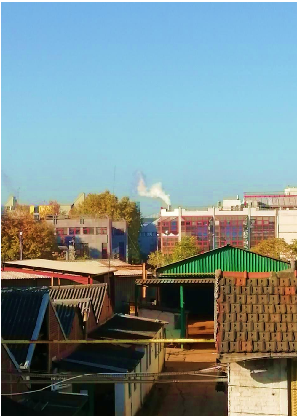
A fumaça em Aubervilliers, França

AO CITAR ESTE TRABALHO, UTILIZE A SEGUINTE REFERÊNCIA: