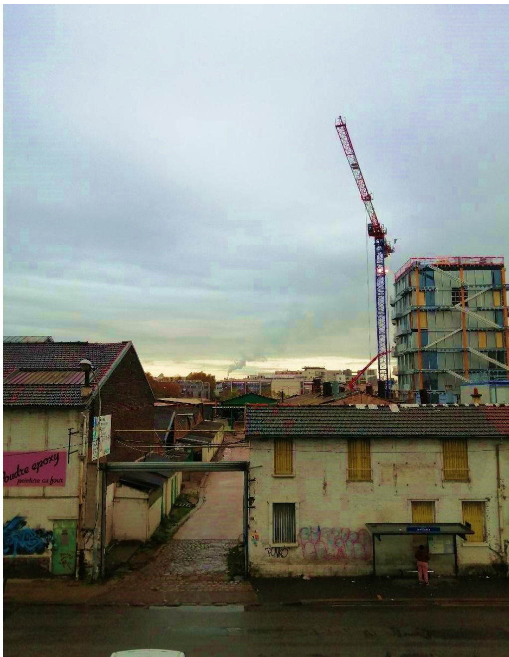
A fumaça em Aubervilliers 2, França

AO CITAR ESTE TRABALHO, UTILIZE A SEGUINTE REFERÊNCIA: ALMEIDA, Fernanda Oliveira de. A paisagem urbana e os resíduos perigosos: uma regionalização da fumaça. Revista Ensaio de Geografia . Niterói, vol. 8, n° 15, pp. 69-75, setembro-dezembro de 2021. Submissão em: 02/04/2021. Aceite em: 02/11/2021. ISSN: 2316-8544