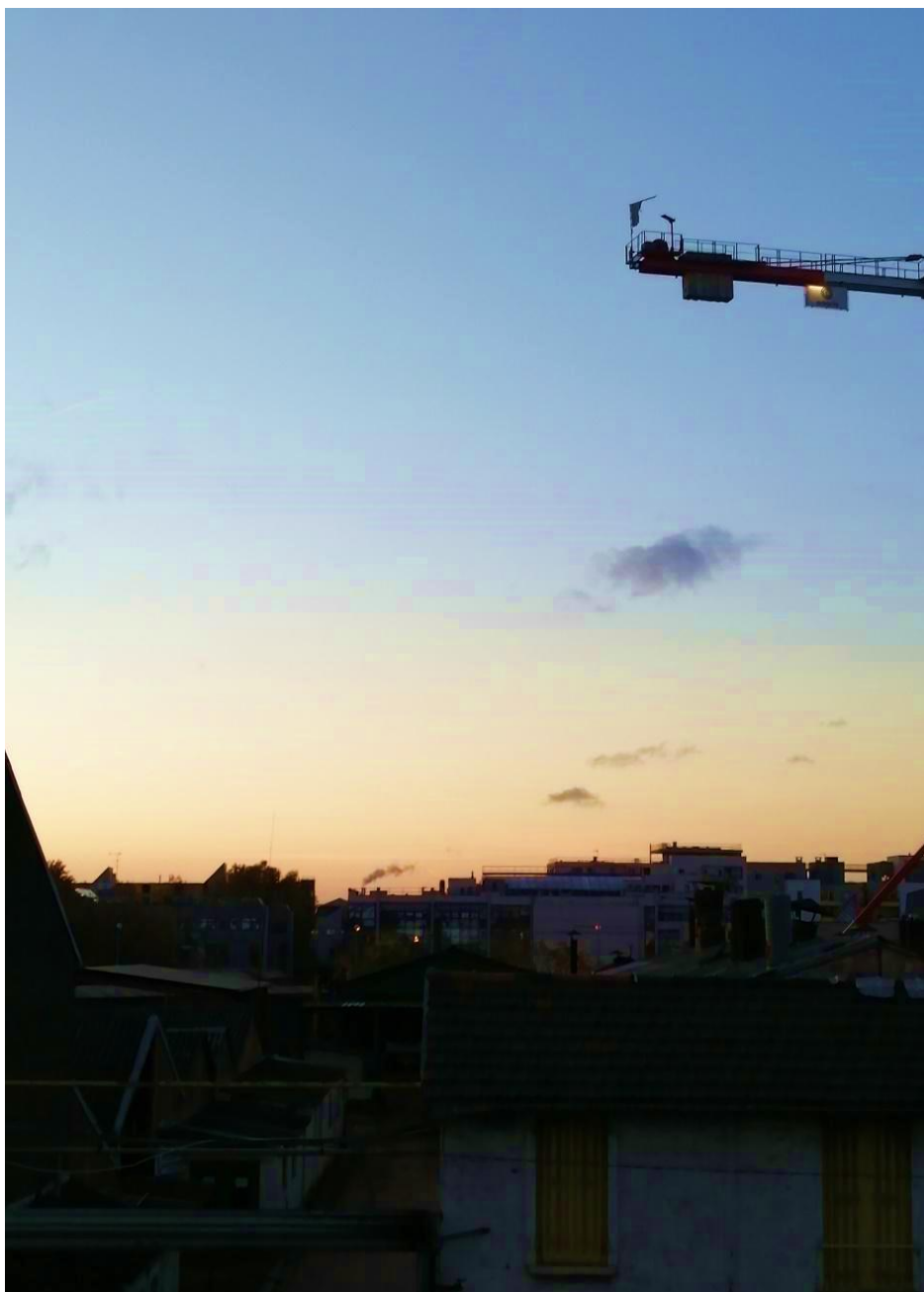
A fumaça em Aubervilliers 3, França

AO CITAR ESTE TRABALHO, UTILIZE A SEGUINTE REFERÊNCIA: ALMEIDA, Fernanda Oliveira de. A paisagem urbana e os resíduos perigosos: uma regionalização da fumaça. Revista Ensaio de Geografia . Niterói, vol. 8, n° 15, pp. 69-75, setembro-dezembro de 2021. Submissão em: 02/04/2021. Aceite em: 02/11/2021. ISSN: 2316-8544