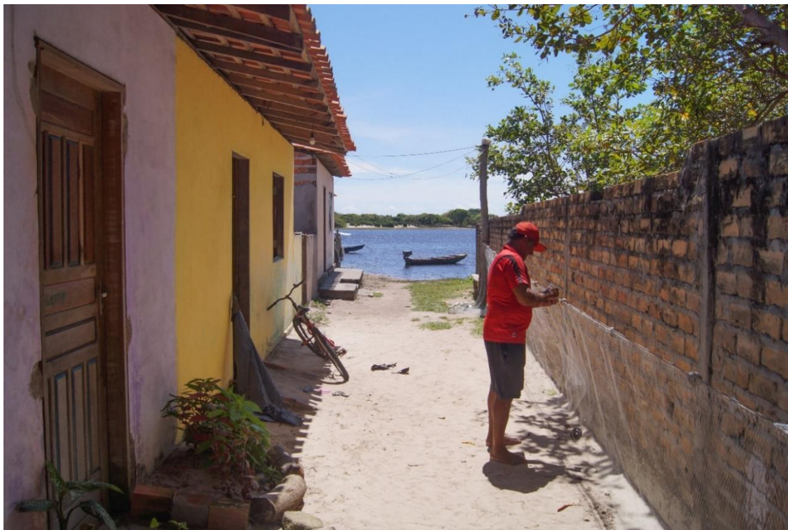
Figura 4: Pescador tecendo a rede de pesca, no bairro Alto Formoso, às margens do lago de Santo Amaro.