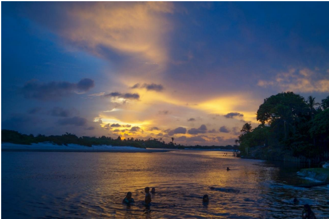
Figura 8: Pessoas tomando banho no Rio Alegre, ao pôr do sol.

AO CITAR ESTE TRABALHO, UTILIZAR A SEGUINTE REFERÊNCIA: