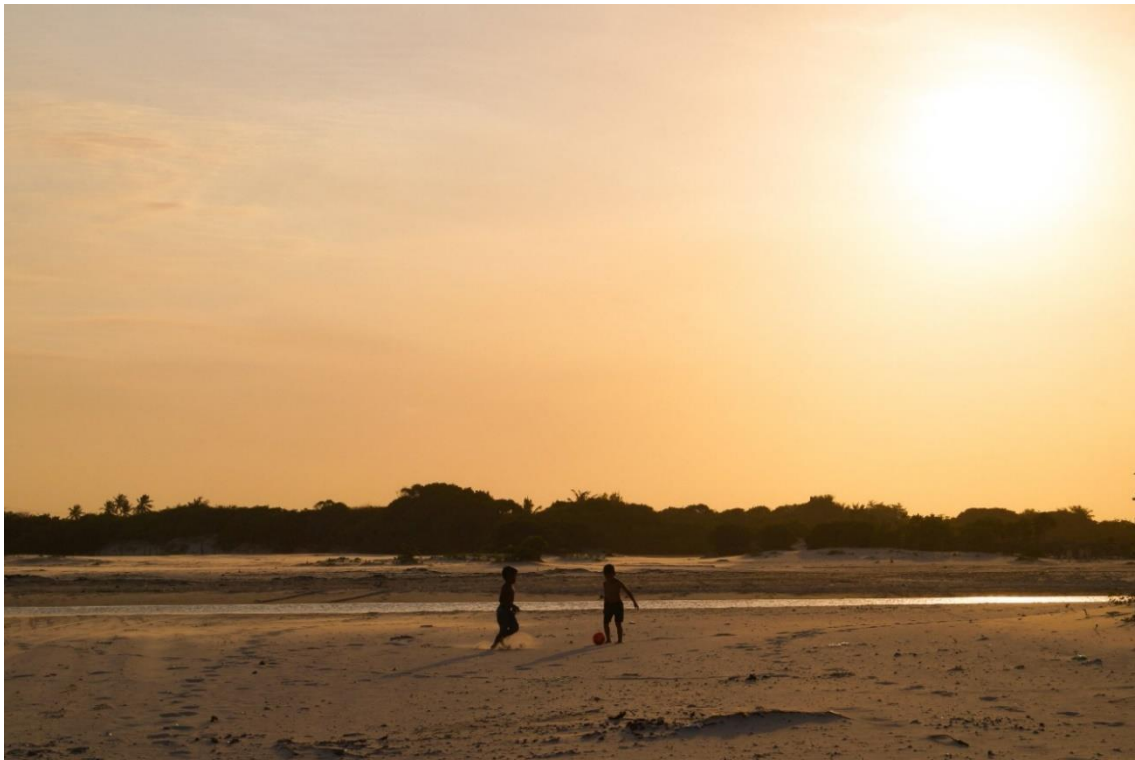
Figura 7: Crianças brincando de bola às margens do Rio Alegre.

AO CITAR ESTE TRABALHO, UTILIZAR A SEGUINTE REFERÊNCIA: