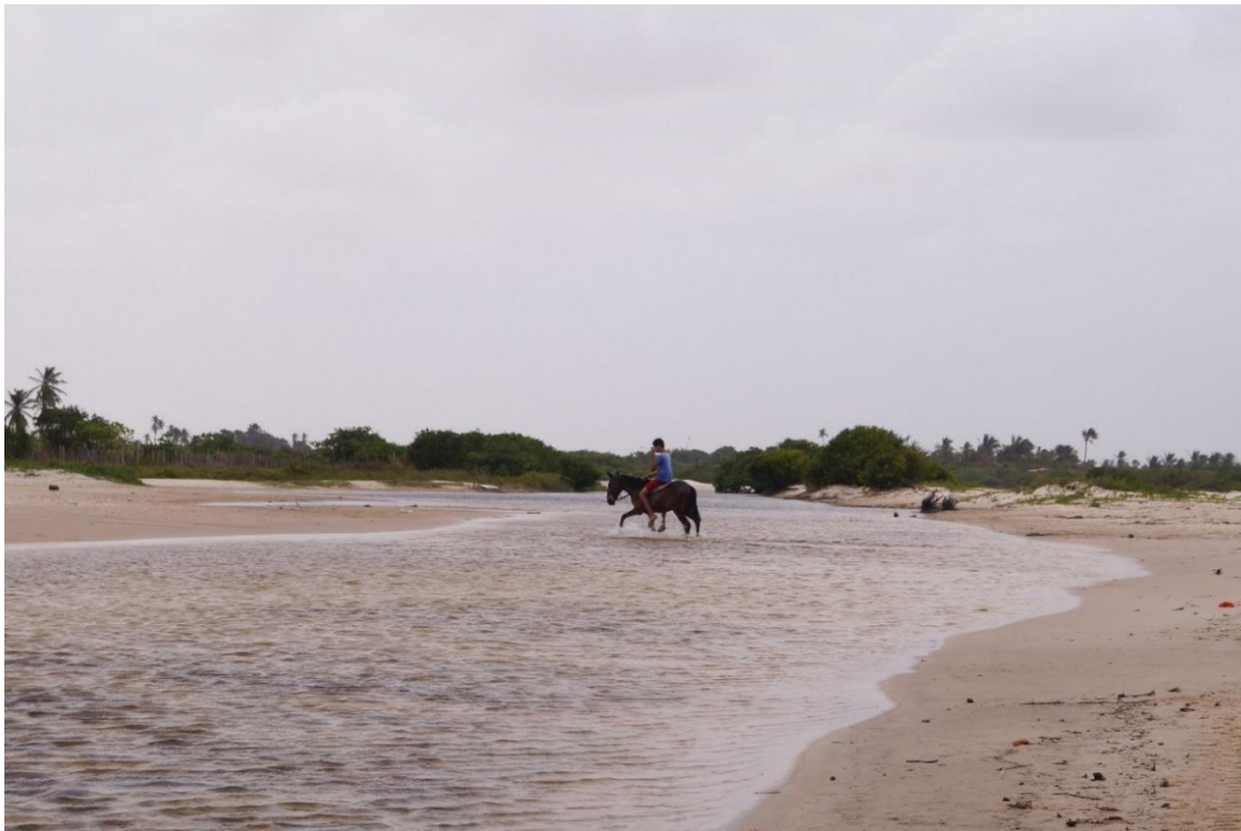
Figura 2: Menino cavalgando no rio Alegre, nas primeiras horas da manhã.

AO CITAR ESTE TRABALHO, UTILIZAR A SEGUINTE REFERÊNCIA: