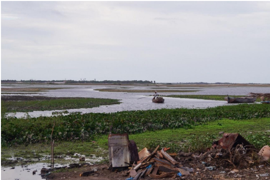
Figura 5: Pescador voltando da jornada de pesca, no lago de Santo Amaro, no período de estiagem e, em primeiro plano, um depósito de resíduos sólidos às margens.

AO CITAR ESTE TRABALHO, UTILIZAR A SEGUINTE REFERÊNCIA: