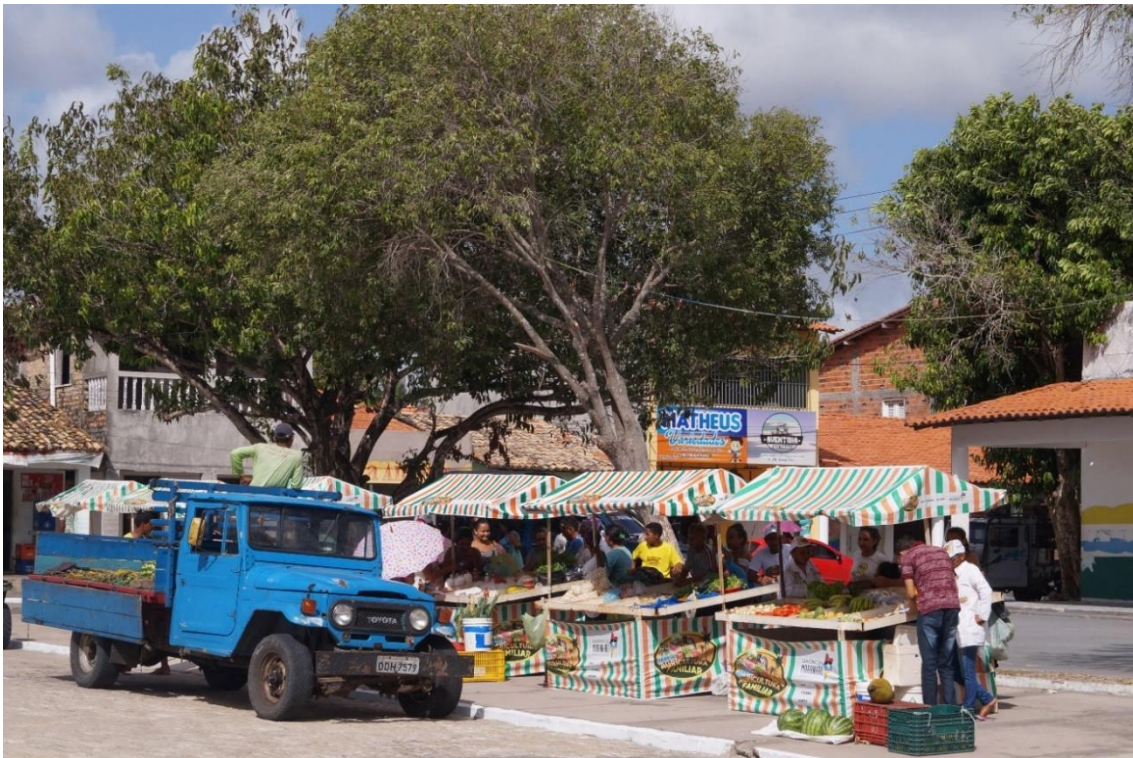
Figura 3: Feira popular, com mercadorias de produtores locais.

AO CITAR ESTE TRABALHO, UTILIZAR A SEGUINTE REFERÊNCIA: