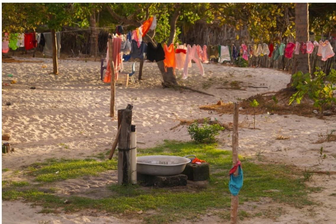
Figura 6: A representação da presença dos poços manuais no cotidiano e as roupas secando no varal.

AO CITAR ESTE TRABALHO, UTILIZAR A SEGUINTE REFERÊNCIA: