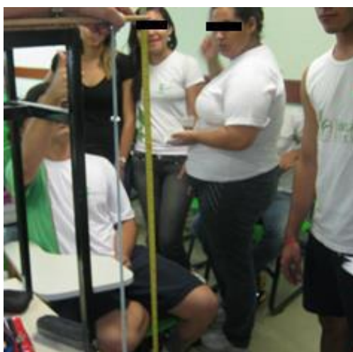
Figura 3: alunos durante a execução do experimento

A figura 3 mostra o momento em que foi feita uma medição como exemplo para ilustrar o experimento: