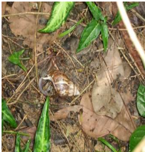
Figura 1: Achatina fulica com a abertura virada para cima.

Vivenciar esta problemática com estudantes do 4º e 5º ano de uma escola da zona centro sul da cidade de Manaus – Amazonas nos proporcionou dados bastante interessantes. Ao realizar atividades educativas fora do espaço formal escolar, buscávamos despertar um sentimento de indignação para esta problemática tão próxima a nossas residências e por desconhecermos a gravidade de tal questão, a comunidade acomodou-se a situação. Nesta atividade encontramos diversas conchas do molusco em um terreno baldio, além de evidenciarmos algumas conchas com a presença de água em seu interior. Alguns caramujos africanos após morrer, suas conchas são encontradas com a abertura virada para cima (Figura 1). Dessa forma, ao chegar o período chuvoso (janeiro a maio), acabam por encher de água o que pode servir de criadouro para o mosquito Aedes aegypti . Grande parte desses criadouros fica a disposição por todo o período chuvoso, até que retorne o período da seca, onde poderá secar novamente.