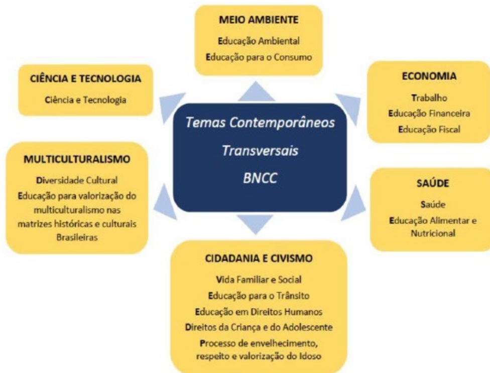
Figura 1 – Macroáreas temáticas dos TCTs e respectivos temas contemporâneos

As macroáreas dos TCTs podem ser visualizadas na Figura 1.