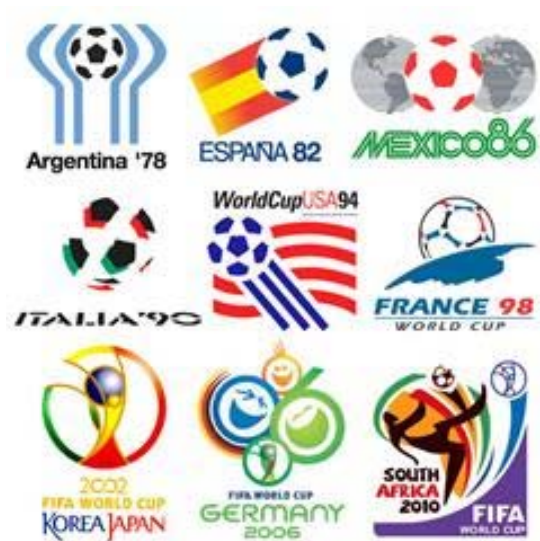
2. Logotipos 1978 a 2010