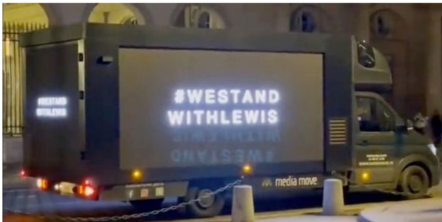
Figura 4 - Imagem do caminhão com placas de LED em frente a sede da FIA

Além das mensagens nas redes sociais, fãs de Lewis Hamilton organizaram intervenções para demonstrar o seu descontentamento com o acontecido, sendo que as mais notáveis foram feitas na noite da entrega do troféu de campeão para Max Verstappen. Durante o evento, que aconteceu na sede da federação em Paris, um caminhão com painéis de LED circulou em frente a entrada do prédio, mostrando imagens do piloto britânico, bem como a hashtag #westandwithlewis (nós estamos com Lewis, em tradução livre).