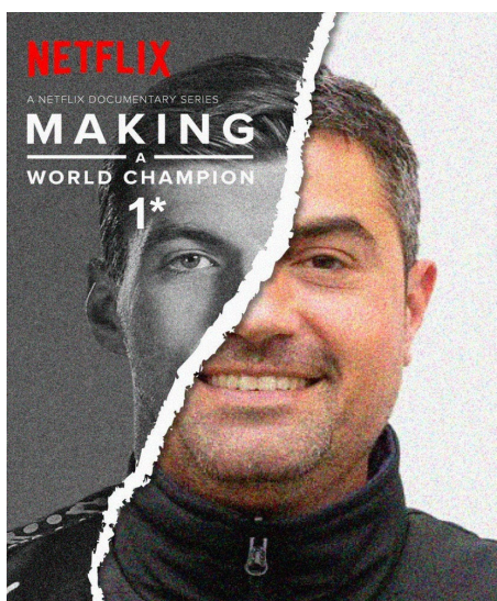
Figura 3 - Meme feito sobre Max Verstappen e a atuação de Michael Masi

Outro momento que gerou novo movimento entre os fãs foi a divulgação do relatório da FIA, em que a entidade atribuiu o resultado a um “erro humano” cometido por Michael Masi (De Vivo, 2022). A partir disso, novos comentários foram realizados, bem como uma nova hashtag, #humanerrorchampion (campeão por erro humano). Também foram produzidos alguns memes, como este, que simula a capa do documentário criminal ‘Making a Murderer’, no entanto, sobrepondo os rostos de Verstappen e de Masi, mudando o título para ‘Making a World Champion’, juntamente com o número um e um asterisco, indicando que há uma observação a ser feita em relação a isto.