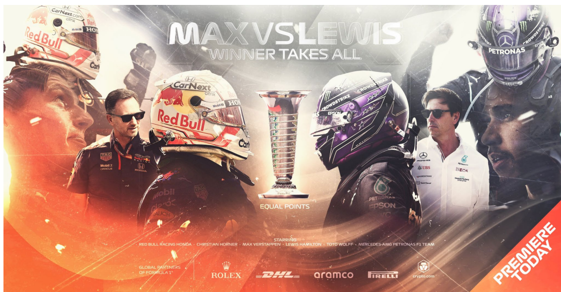
Figura 2 - Imagem publicada pela conta oficial da Fórmula 1