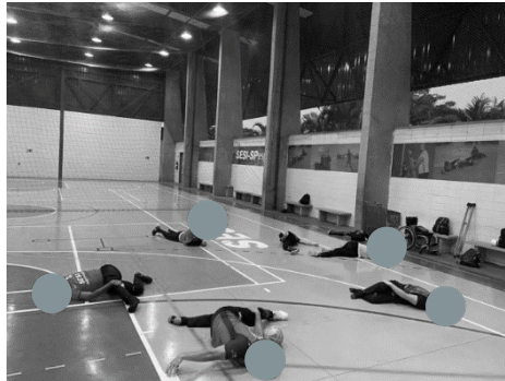
Figura 2- Projeto Brasil Diversidade – Modalidade Bocha – Suzano, São Paulo.