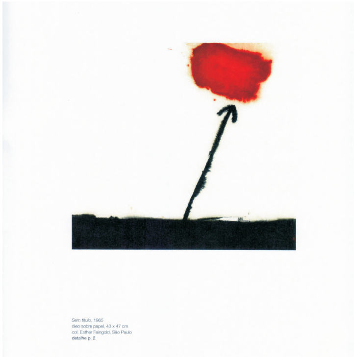
Fig. 1. Sem Título, 1964 técnica mista sobre madeira 92 x 91 cm coleção particular