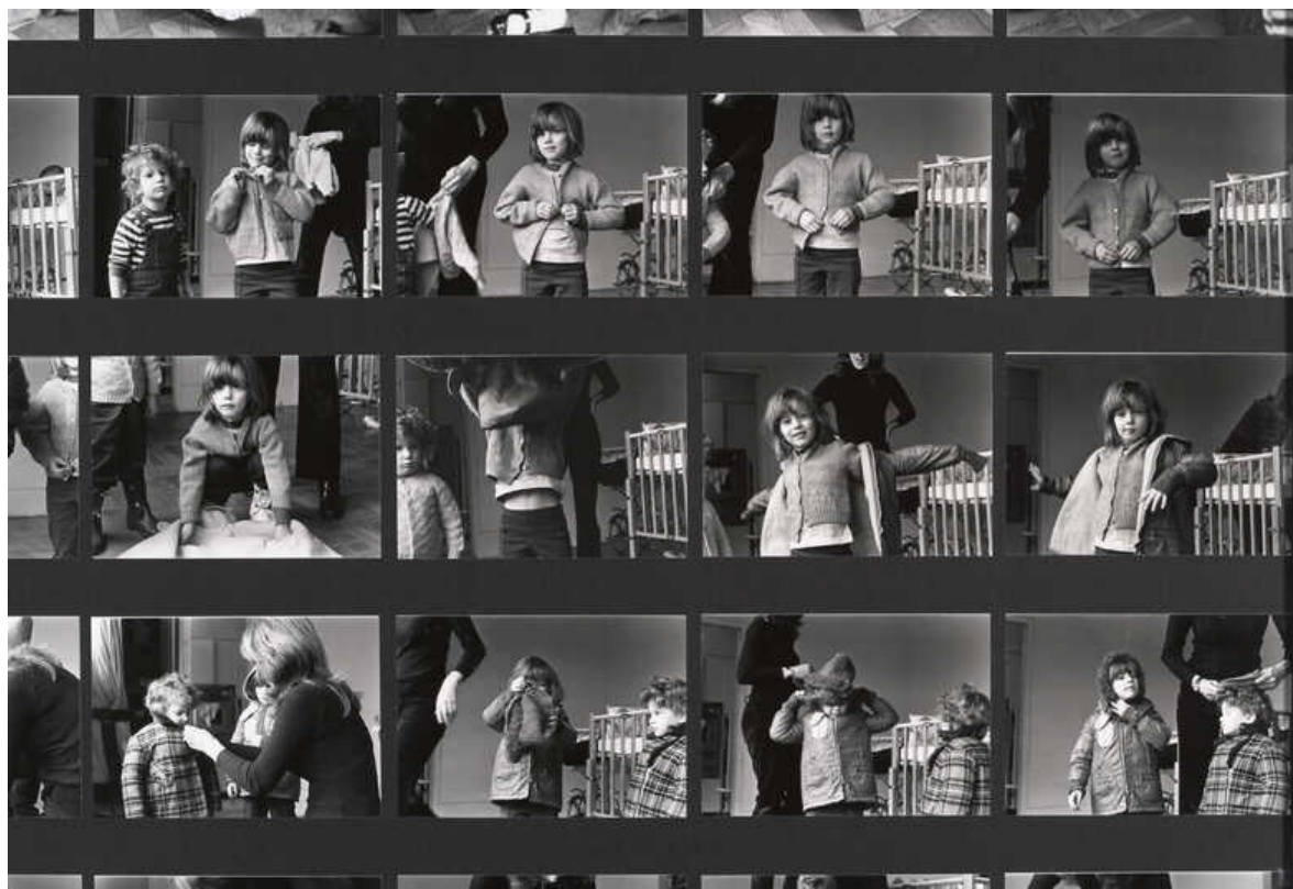
Figura 1: Mierle Ukeles Dressing to Go Out/Undressing to Go In (detalhe), 1973. Fotografias em preto e branco.

Ela utiliza, no início do manifesto representado pela figura 2, usa a palavra CARE , que significa “cuidado” em português, mas também significa “se importar”, reforçando a dimensão relacional e empática de todo o projeto, o trabalho dialoga sobre direitos, sobre conquista de reconhecimento de um esforço que é constantemente ignorado. Ali não estão só pessoas que auxiliam a comunidade, estão, na verdade, quem realiza toda o suporte “invisível” que mantém a sociedade em constância, garantem o funcionamento a partir de trabalhos não valorizados, muitas vezes não remunerados como no caso da maternagem. De um ponto de vista