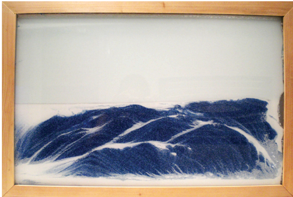
Figura 3 HORIZONTE INDECISO #1 Vidro, água e areia – 43 x 62 cm Autoria: Marcia Xavier , 2010

diz a própria artista em entrevista à Luisa Duarte na época de sua exposição: “Ele me parece um relógio visual, que marcaria esse tempo mais expandido” 3 .