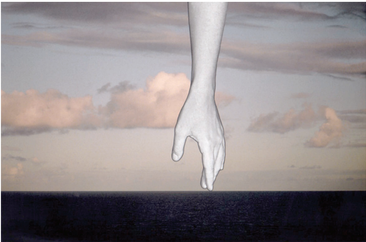
Figura 4 HORIZONTE POSSÍVEL Fotografia - 40 x 60 cm Autoria: Marcia Xavier, 2010

HAAR, Michel. Arte e Corporeidade: Merleau-Ponty. In: _____. A obra de arte: ensaio sobre a ontologia das obras. Rio de Janeiro: Difel, 2007.