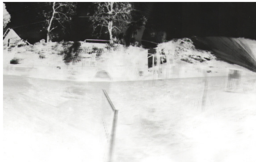
Figura 3 - De varanda à quadra

Há por detrás das lentes, um olho que escolhe, recorta e define o momento certo do clique, de acordo com seus desejos. Como nas palavras de Luis Humberto (2000), o instante da fotografia se dá no momento em que há o encaixe entre o que está sendo fotografado e alguma idéia pré-existente do fotógrafo. Uma fotografia é um resultado de um bom e fugaz encontro, previsto ou inesperado, mas também de uma busca, de uma intenção que possibilita ver coisas que poderiam passar despercebidas (WUNDER, 2006, p. 10).