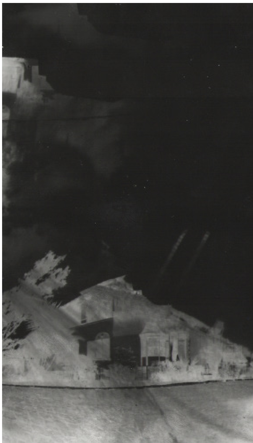
Figura 6 - De varanda, tempo

Registraremos impressões do tempo , à la Tarkovsky (TARKOVSKY, 1998, p. 71), mas também registraremos impressões de geografias, impressões de gente em relação a lugares desejanter, construindo sabedorias como Manoel de Barros.