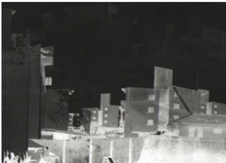
Figura 2 - De varanda à esquerda

Viajantes experimentarão essa ecologia pensada em pensamentos, inventando mundos e modos de existência singulares, vivenciando a arte em imagens. Viajantes seguirão desvelando imagens em um roteiro ecogeográfico, buscando pistas da “menor das ecologias” que “não cessa de se fazer nas linhas de fuga traçadas, nas quais se desliza” (GODOY, 2008, p. 286), com uma exigência: “mais do que descobrir, a coragem de esquecer-se das descobertas: esta é a saúde exigida pela menor das ecologias” (GODOY, 2008, p. 286). Para fugir das amarras, inventar outras maneiras de resistir, ou ainda, com Aspis (2011), inventar para re-existir.