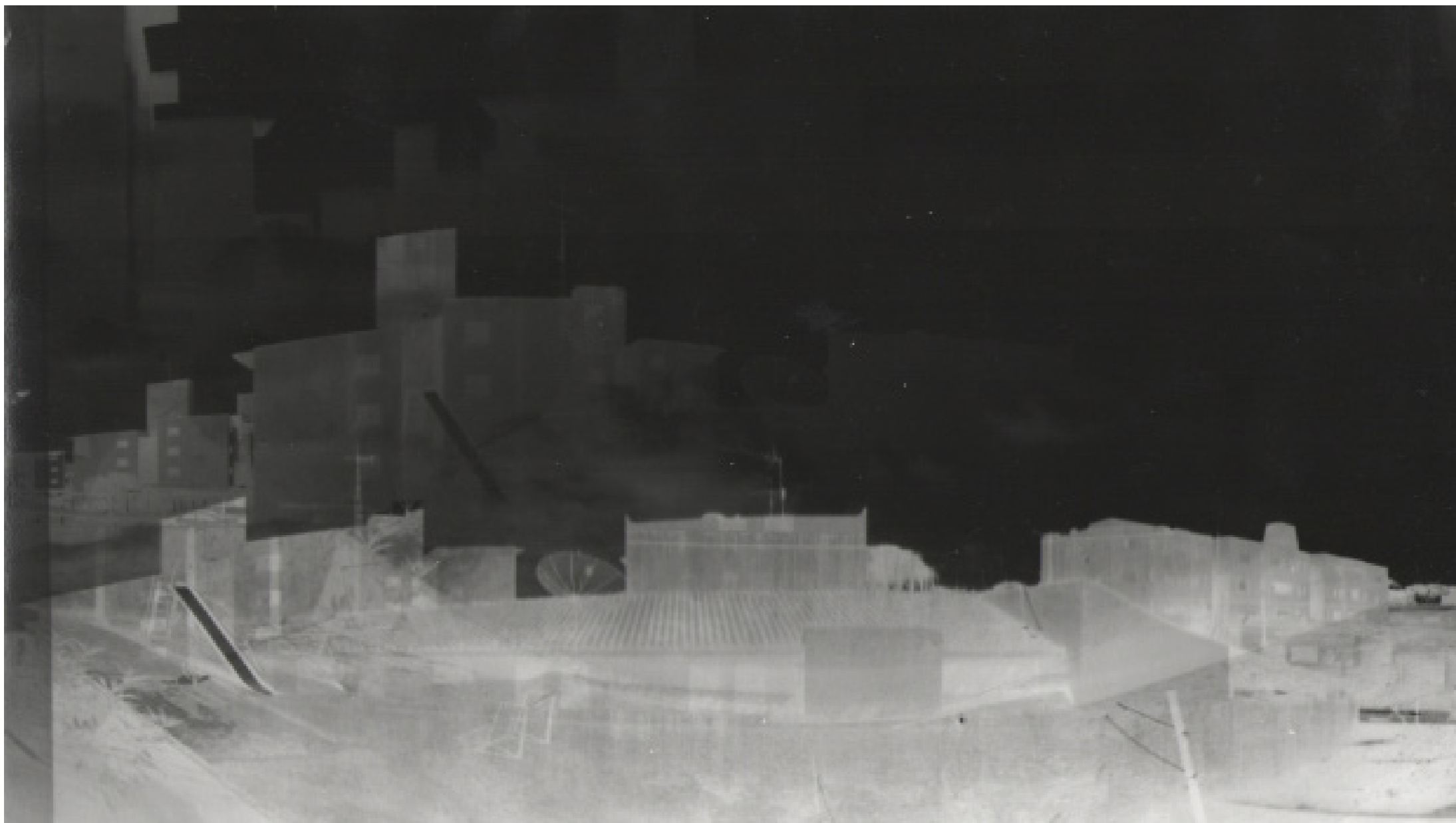
Figura 5 - De varanda o mundo Foto: Luís M. Martinelli, 2011

jeitos de se ver, sentir e registrar um lugar, lugar este que se forma, modifica e guarda tensões.