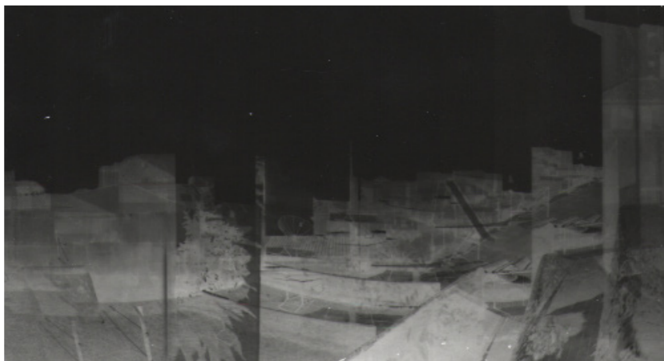
Figura 4 - De varanda à favela Foto: Luís M. Martinelli, 2011

Um mundo de imagens o viajante pode revelar, refletir, omitir em seu cotidiano. A fotografia não reproduz o real, recria-o. Da mesma forma, a câmera pinhole com mais de um orifício captura o inusitado, cria novas identidades em sobreposição. Mostramos nossa forma de ver o mundo em diferentes ângulos. Somos invadidos por imagens em que podemos acreditar ou podemos, ainda, com elas, pulverizar o que vemos. Com as fotos pinhole podemos literalmente tocar as fotos, mudando nossa participação no ato de fotografar e imagear o espaço (Figura 4).