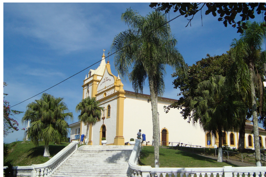
Figura 3 - Igreja Matriz de Nossa Senhora do Pilar Foto: Beatriz Helena Furlanetto, 2014.