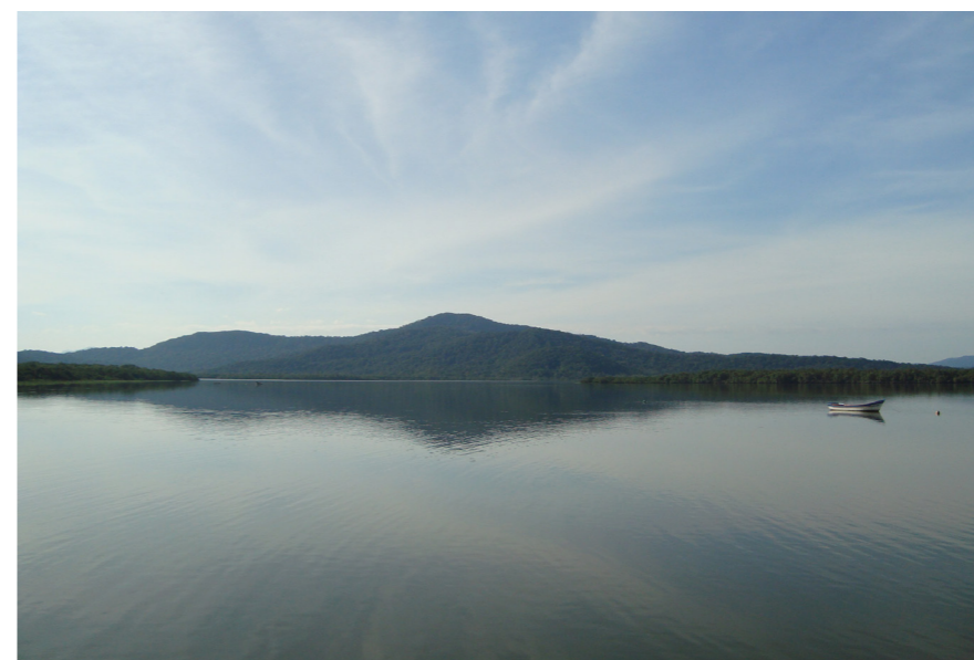
Figura 6 - O mar de Antonina