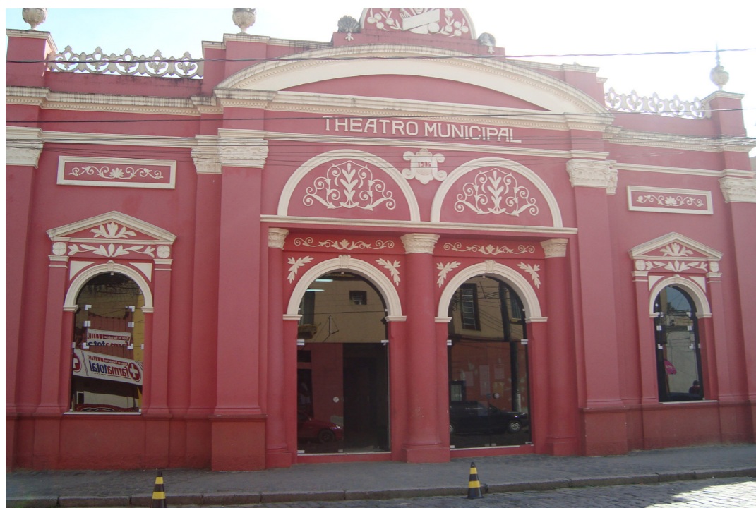
Figura 2 - Teatro Municipal de Antonina