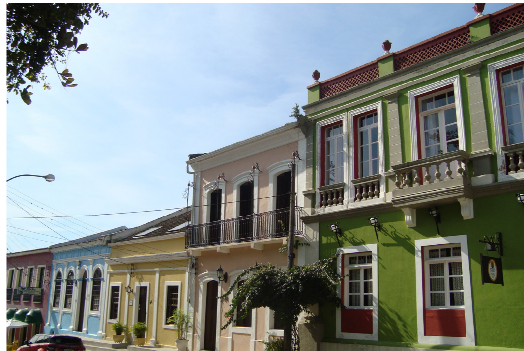
Figura 5 - Construções coloniais de Antonina Foto: Beatriz Helena Furlanetto, 2014.