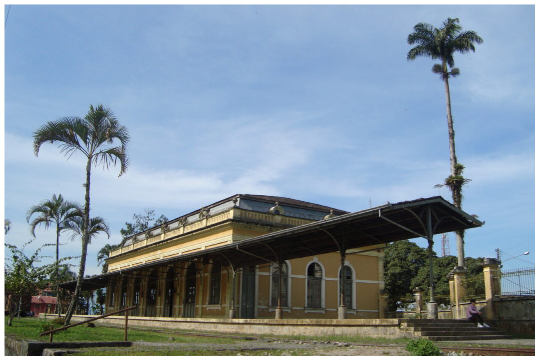
Figura 4 - Estação Ferroviária de Antonina