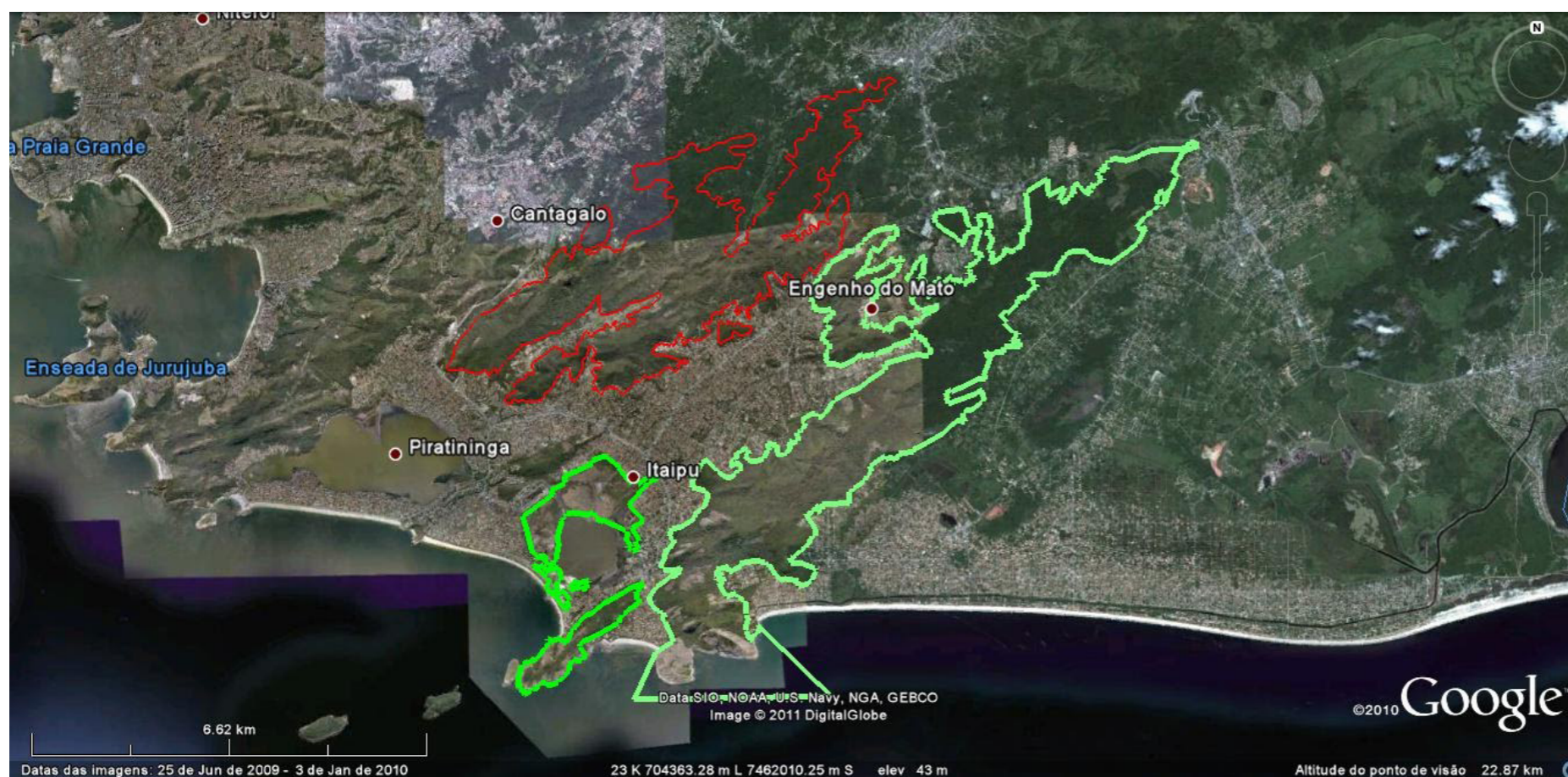
Figura 6: Limites do Parque Municipal Darcy Ribeiro (vermelho), município de Niterói e do Parque Estadual da Serra da Tiririca (verde), divisa dos municípios de Niterói e Maricá, RJ.

A cidade que se move: mutabilidade da paisagem no leste metropolitano do Rio de Janeiro Eloisa Carvalho de Araujo