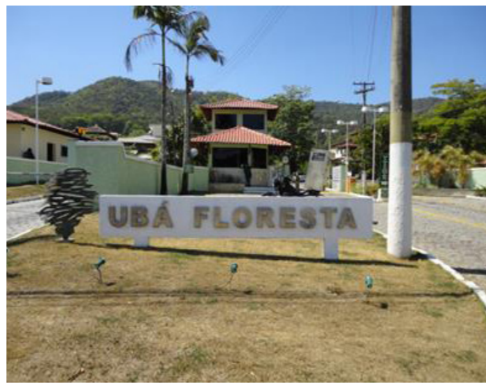
Figura 5: Portaria condomínio Ubá Floresta.

A cidade se espalha e ressalta a desigualdade entre os lugares, sem falar de outros tipos de desigualdade, sobretudo, para influir na disputa pela apropriação de recursos naturais e bens ambientais, tudo porque a urbanização precisa prosseguir.