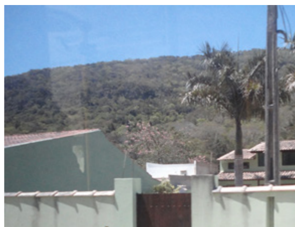
Figura 9: Acesso Condomínio Residencial.