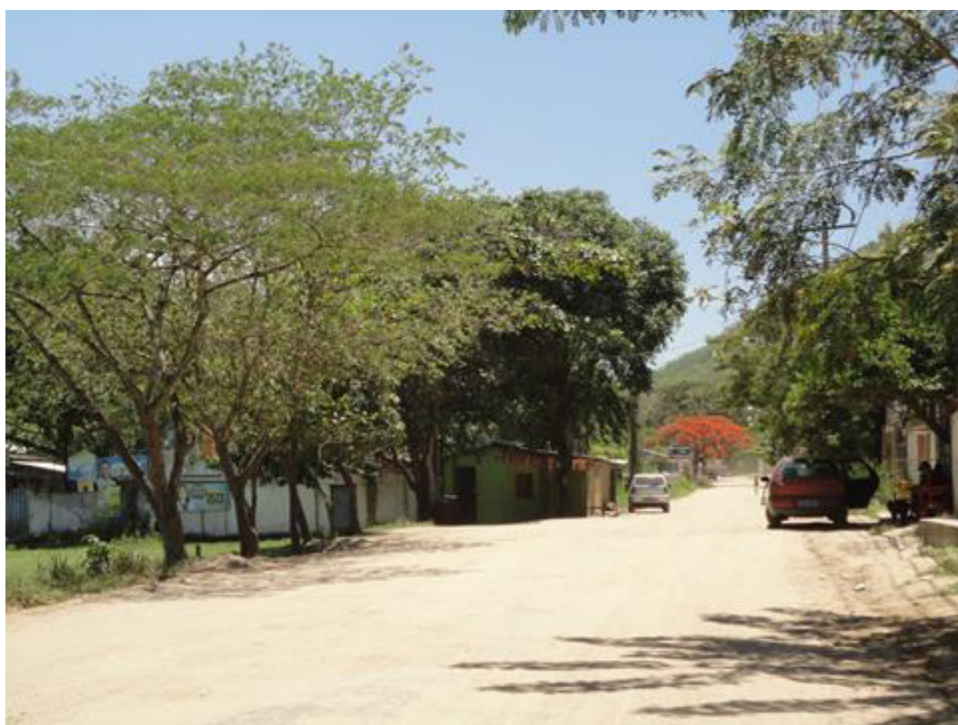
Figura 2: Rua Bairro Engenho do Mato, Niterói, RJ.

A preocupação com a organização do espaço e a distribuição das sequências de ocupação muitas vezes se revelam através de dispositivos de controle do espaço urbano, pela falta de serviços públicos, plano de ordenamento do solo, zoneamento e regulamentações adequadas, entre outros aspectos.