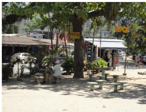
Figura 7: Praça Central Engenho do Mato.

Enquanto recurso teórico propomos abordar o conceito de paisagem a partir da ideia de sua mutabilidade. Isto é, ao utilizar o conceito de paisagem cultural, adotamos a premissa de explicitar o fato geográfico, valorizando o que está contido no espaço, sobretudo, as transformações espaciais, como estas se revelam e como o espaço é influenciado pelas mesmas, e, por fim, mas não mais importante, a apreensão do todo, do espaço plural, a partir das práticas cotidianas.