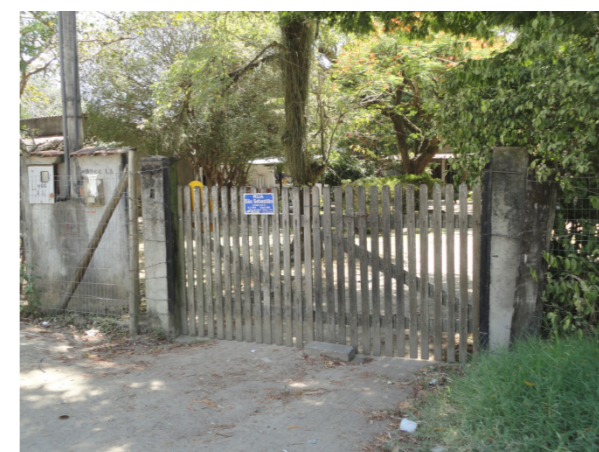
Figura 10: Acesso Chácara, Engenho do Mato.

Nesse aspecto, a interpretação da contribuição de Corrêa (1998), no sentido de valorizar o papel da cultura enquanto ente que proporciona a diversidade da organização espacial e sua dinâmica, assim como, de Cosgrove (1998) que, de forma emblemática, posiciona a cultura como elemento que é determinado e determinante da consciência e das práticas humanas, nos direciona para a adoção da paisagem a partir da ideia de sua mutabilidade.