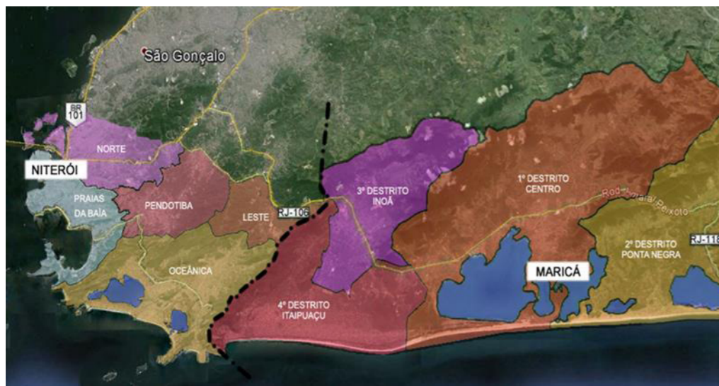
Figura 1 - Distritos dos municípios de Niterói e de Maricá, RJ.

Ao explorar, no presente artigo, o diálogo entre as abordagens de autores como Corrêa, Lefebvre e Acselrad no sentido de construir reflexões sobre o futuro na periferia urbana metropolitana, busca-se salientar a preocupação com a mutabilidade das paisagens nesta região influenciada pela articulação de interesses entre os diversos agentes sociais e econômicos, assim como, o papel do planejamento frente aos efeitos das atividades produtivas sobre o ambiente. Nessa pretensa