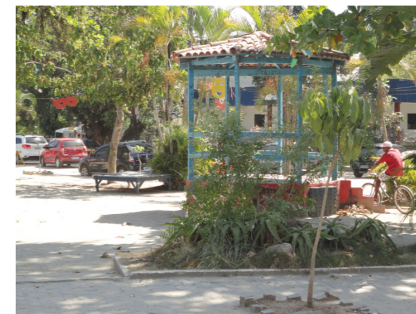
Figura 8: Coreto da Praça Engenho do Mato.