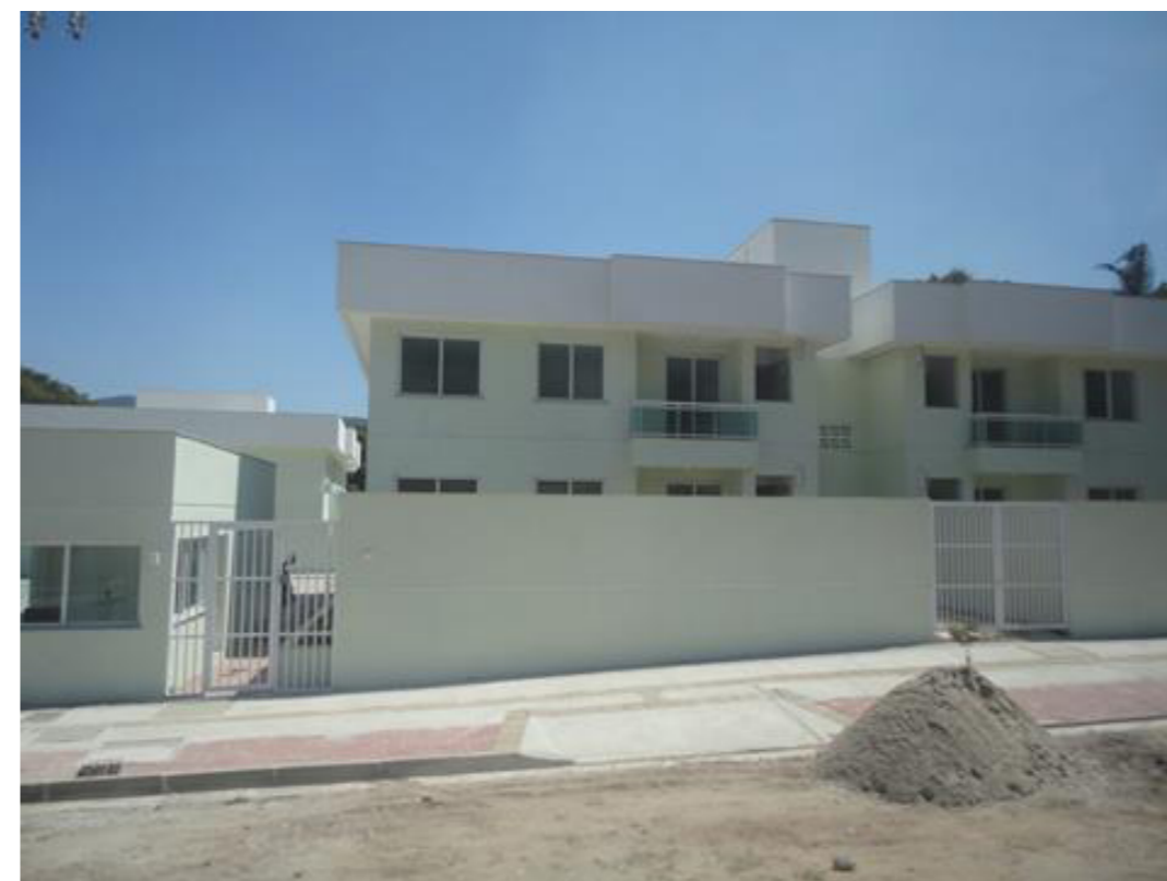
Figura 3: Condomínio Região Oceânica, Niterói, RJ.