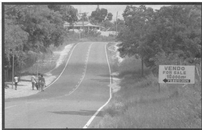
Foto 1. Estrada de acesso da rodovia estadual BA-099 ao município de Conde, Bahia, a 175 km de Salvador.

O crescimento das atividades de turismo e veraneio contribui já há um certo tempo para converter em objeto de consumo uma série de lugares, com destaque para a orla litorânea de países de clima ameno, tropicais e equatoriais. A orla litorânea brasileira, com 8.698 km de extensão, uma das mais extensas orlas litorâneas tropicais do mundo, não constitui uma exceção nesse sentido.