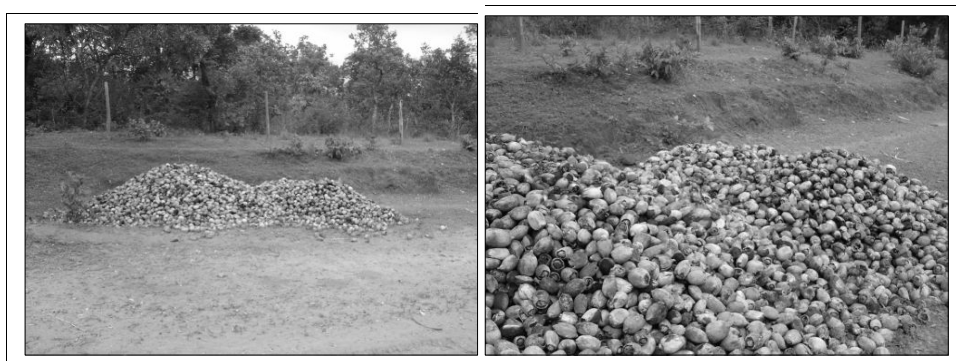
Imagem em: 08 jan. 2008. Autoria: BETHONICO, M. B. de M.