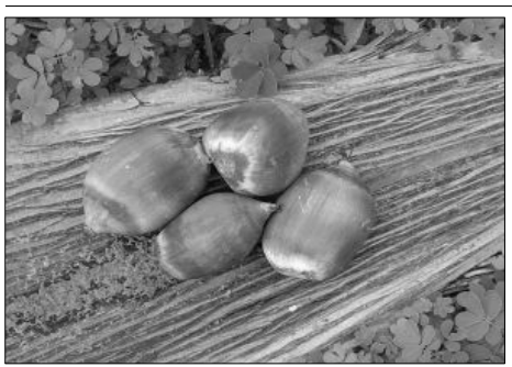
Figuras 3 e 4. Palmeira do babaçu e fruto - região de Bonito de Minas.

Imagem em: 08 jan. 2008. Autoria: BETHONICO, M. B. de M.