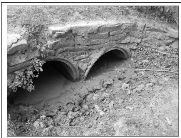
Figura 7. Córrego Maria Crioula – Estrada de acesso a Bonito de Minas. Imagem em: 08 jan. 2008.

A comunidade demonstra a preocupação com a redução da água, com o esgotamento desse recurso em alguns lugares (fig. 7). A redução da água em algumas comunidades fez com que os córregos secassem totalmente, levando o morador a furar poços para conseguir água. Segundo depoimentos, esse é o caso do córrego Palmeira, na comunidade Vereda que teve sua cabeceira desmatada para a produção de carvão.