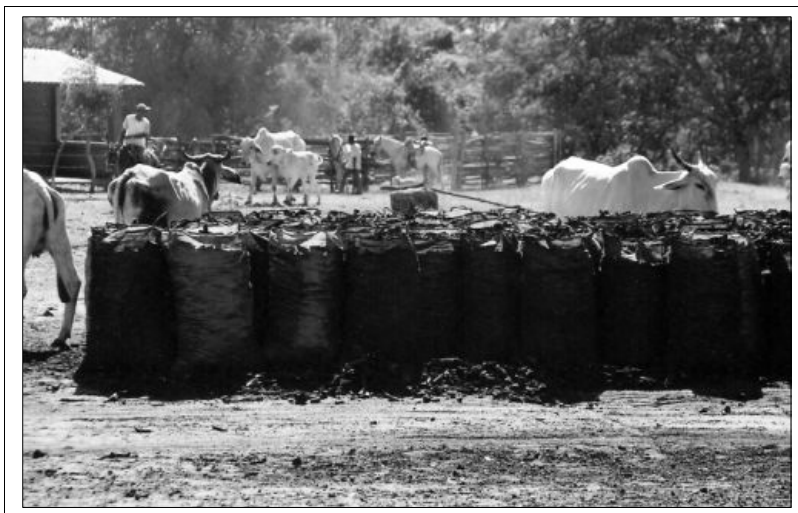
Figura 2: Carvão aguardando carregamento. Comunidade da Vila Pandeiros.

Na área da APA existem pontos onde o carvão é depositado, aguardando transporte (fig. 2). Segundo informações coletadas, nesses pontos misturam-se o carvão nativo com autorização ao clandestino.