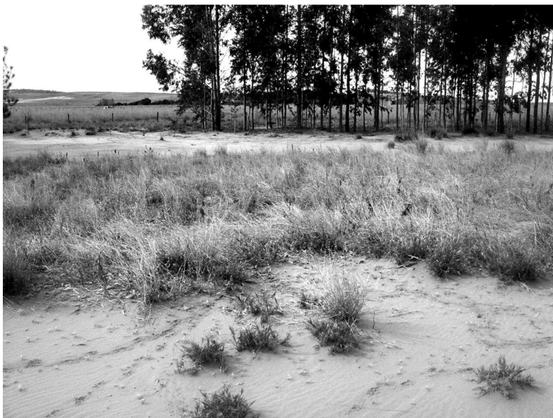
Figura 3 – Sítio de areal com eucalipto em Manoel Viana (os autores, 2007)