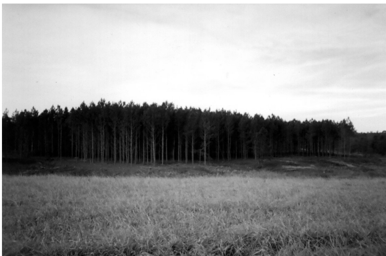
Figura 2 – Areal totalmente recoberto com pinus e brachiária em São Francisco de Assis (os autores, 2007)

Desse modo, a maioria dos agricultores/pecuaristas concentra seus esforços de combate aos areais com a introdução de dispositivos que evitem a ação do vento. Mitigam-se as consequências do pisoteio do gado, com o manejo de forrageiras (Capim-Marandu: Brachiaria brizantha e Capim-Pangola: Digitaria decumbens ), e reduz-se a velocidade dos ventos com o plantio de capões de eucalipto nos focos iniciais de arenização. A aplicação conjunta desses dois dispositivos, “quebra-vento” e forrageiras, recebe entre os nativos o nome de “sitiamento” ou “bordadura” e são observados em toda a região, como nos exemplos de São Francisco de Assis (Figura 2), Manoel Viana (Figura 3) e Alegrete (Figura 4).