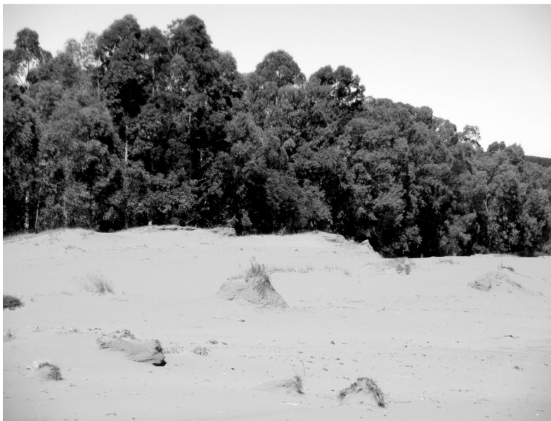
Figura 4 – Sítio de areal com eucalipto em Alegrete