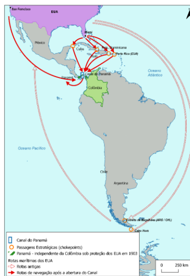
Figura 1 - Canal do Panamá: importância geoeconômica e geoestratégica

iniciou com a proclamação da Doutrina Monroe em 1823 e se consubstanciou com o Corolário de 1904. Após a inauguração do canal, em 1914, o Caribe se transformou numa espécie de mare nostrum dos Estados Unidos (figura 1), configurando-se na primeira condição de grandeza de um império marítimo emergente que, depois, ainda que privilegiando o controle hemisférico, se expandiria por diversas outras regiões do mundo.