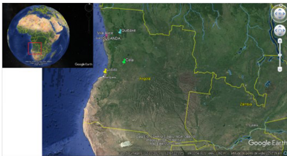
Mapa 1 – Áreas de estabelecimento das famílias dos interlocutores em Angola

O seu avô e sua avó paternos, naturais da região de Ligares (norte de Portugal), emigraram para Angola em 1956 com os quatro filhos ainda crianças, tendo a quinta criança já nascido em território africano, alguns anos depois. A família estabeleceu-se na região de Cela (Mapa 1), em Cuanza-Sul, chegando a Angola a partir do Porto de Lobito (Mapa 1).