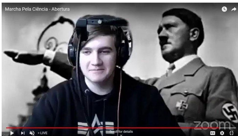
Figura 1 – Marcha pela Ciência (2020), edição Minas Gerais 6 .