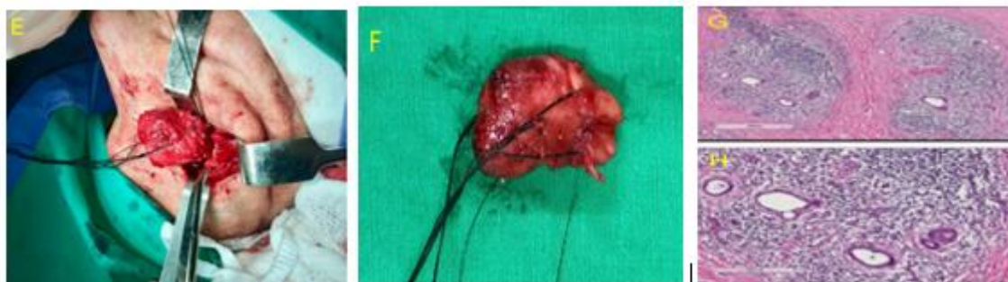
Figura E) Imagem transoperatória da exérese total da lesão com o auxílio de fios de reparo. F) Lesão tumoral benigna de formato oval, consistência firme, margens bem delimitadas e normocrômica. G e H) Lâminas de análise histopatológica (coloração HE).

(Risdon). Após divulsão e dissecação, artéria e veia facial, assim como o ducto da glândula submandibular foram ligados, bem como estruturas nervosas adjacentes preservadas. A sutura dos tecidos internos foi realizada por planos anatômicos com fio absorvível 3-0 (ácido poliglicólico) e, para a pele, optou-se pelo nylon 5-0.