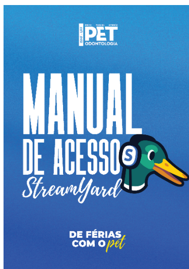
Figura 1 – Imagem ilustrativa da capa do “Manual de acesso” ao evento De férias com o PET especialmente desenvolvido para o membros do grupo PET e professores convidados do evento.

Os inscritos obtiveram acesso ao “Manual do Participante”, que fornecia informações relevantes sobre o grupo PET Odontologia ISNF-UFF e do ciclo de palestras "De Férias com o PET", tal como, orientações, programação do evento, recursos e materiais adicionais de acesso às palestras (Fig. 2).