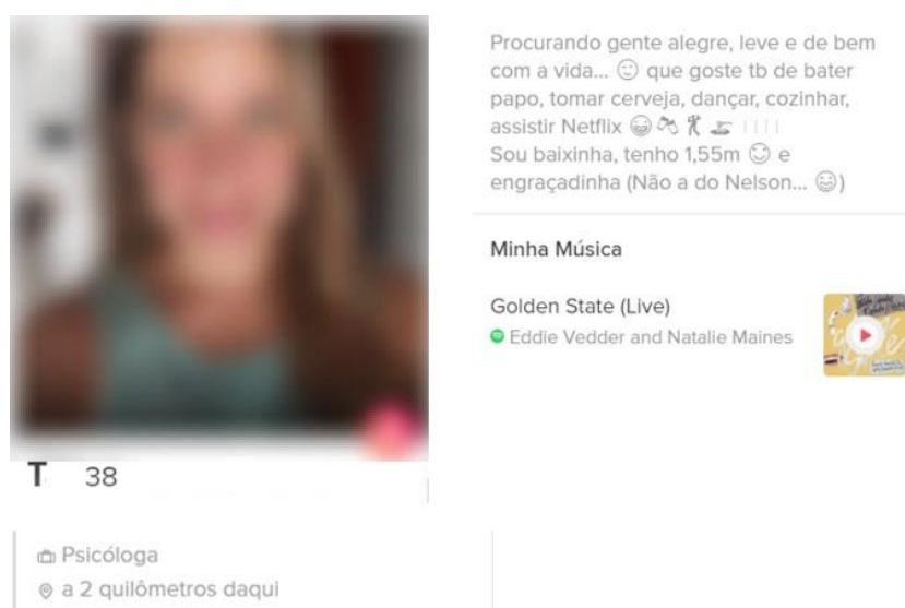
Figura 1 - Recorte 1