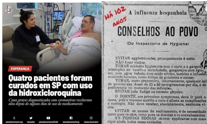
Figura 3 – Posts sobre cloroquina

Fonte: Plataforma Monitor WhatsApp, UFMG.