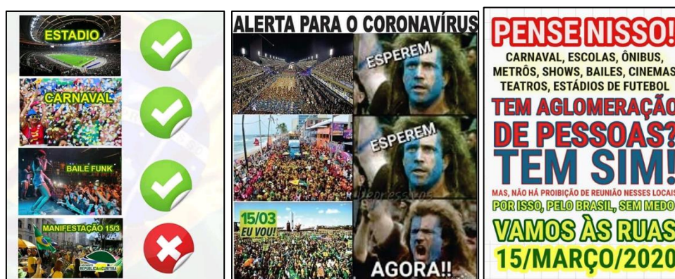
Figura 1 – Posts de 12/03/2020 a favor da manifestação pró-Bolsonaro prevista para 15/03/2020