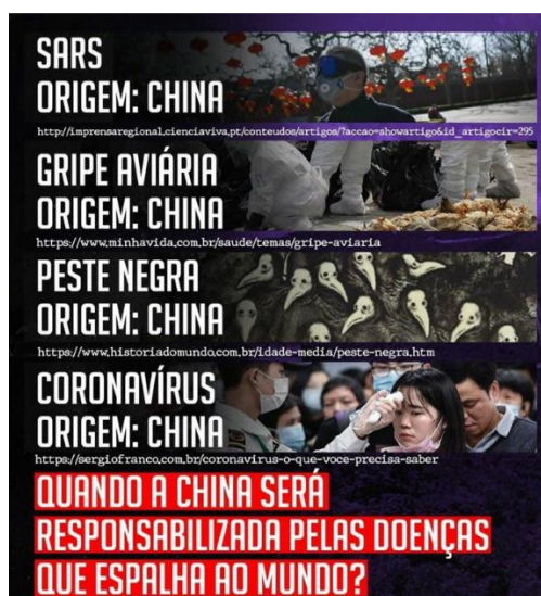
Figura 2 – Post sobre associação da China a diferentes doenças