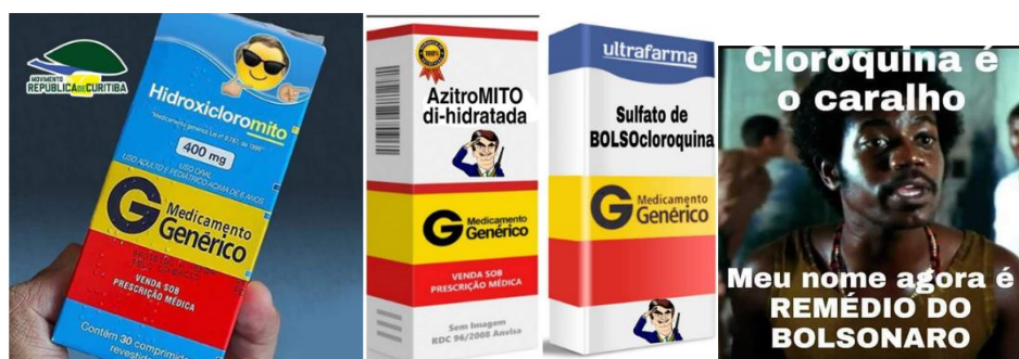
Figura 6 – Posts sobre a cloroquina