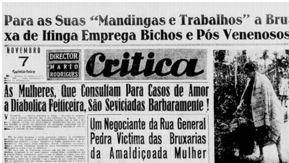
Figura 1 - Jornal Crítica, 07 de novembro de 1929