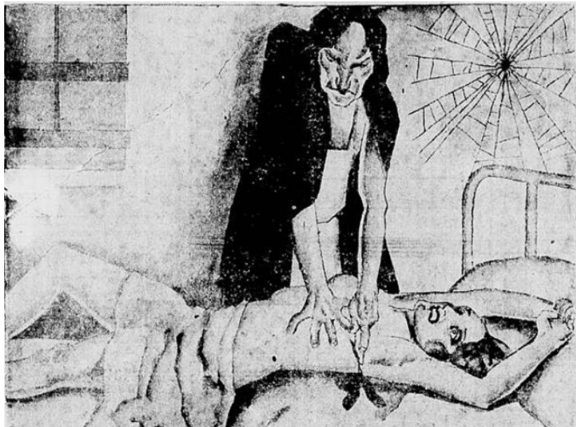
Figura 2 - Ilustração de apoio ao texto, Jornal Crítica , 07 de Novembro de 1929