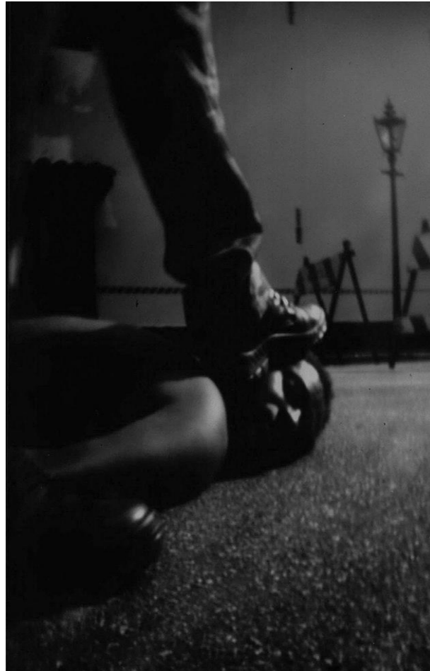
Figura 1 – “Atemporalidade”, de Nay Jinknss