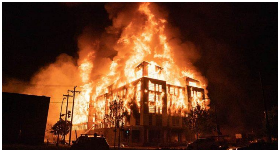
Figura 5 - Fotografia de Mark Vancleave/Associated Press

Fonte: https://www.arkansasonline.com/news/2020/jun/15/officers-resigning-in-minneapolis/ . Acesso em: 15 fev. 2021.