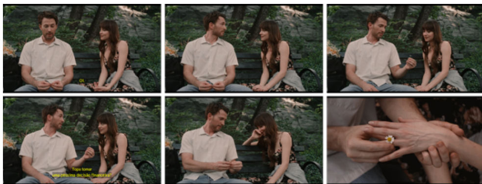
Figura 8: Cena final de Amores Materialistas