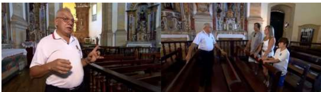
Figuras 3/4 – Plano médio do zelador; plano de conjunto do zelador e turistas.

homem visto também de costas, com olhar inclinado para cima a admirar uma das imagens sacras. Como se pode notar, o importante não é a identificação dos sujeitos que transitam pelo local, mas a disposição em observar cuidadosamente os detalhes sacro-históricos ali contidos. Há ainda algumas captações em plano geral da fachada da igreja, acompanhadas de um tilt .