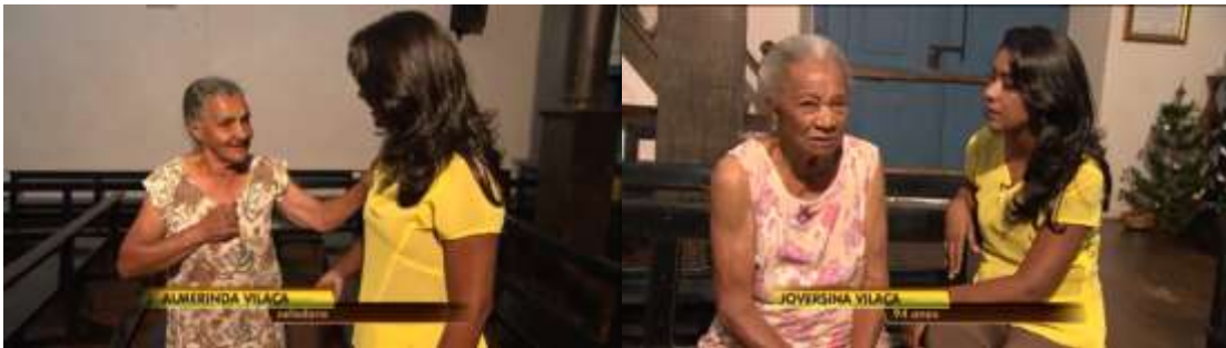
Figuras 11/12 – Planos médios das fontes com a jornalista

conversa com uma delas, que é zeladora da igreja. Ambas em plano médio, perto dos bancos de madeira escura (figuras 11 e 12). Estas senhoras, segundo a jornalista, são “as guardiãs da matriz”, simbolizando a autoridade adquirida por elas em função do tempo dedicado à igreja, do empenho em manter vivas as tradições do templo e das práticas ritualísticas nele praticadas.