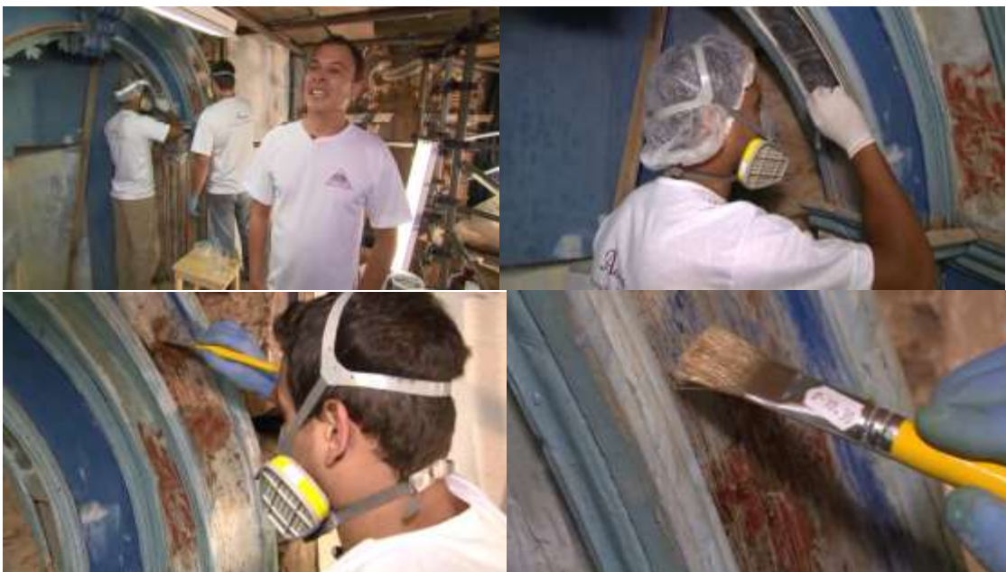
Figuras 7/10 – Planos médios de fontes; big close ups do pincel

guardadas numa sala separada. Voltamos ao coordenador para um breve encerramento de suas considerações e, após ele, quem assume a fala é um profissional descrito como “restaurador”, captado em plano médio. Ao fundo, estão dois homens trabalhando, sendo possível identificar também assoalhos, madeiras, barras de ferro compondo o ambiente em reforma. Vez por outra, um big close up se intercala e exhibe as mãos dos homens trabalhando com pincel e outros instrumentos (figura 10).