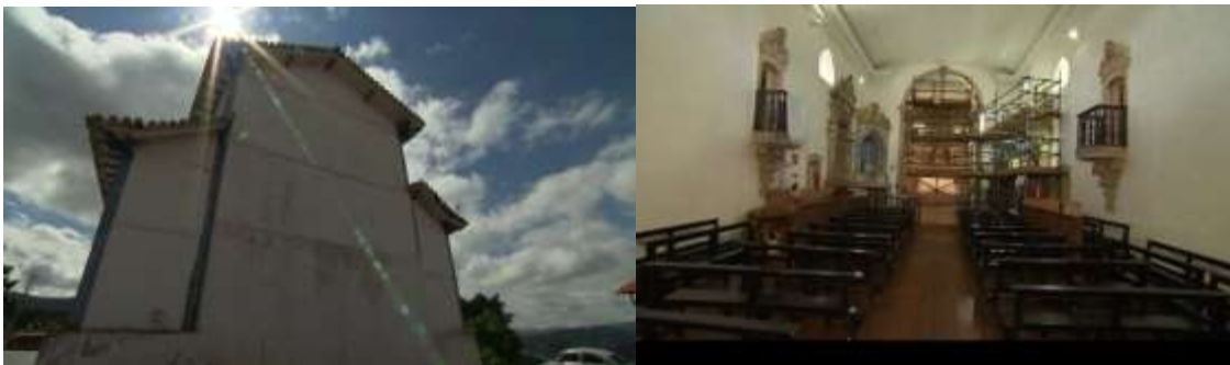
Figuras 5/6 – Contra-plongée da igreja; plano de ambientação evidencia reforma da igreja

Já na edição de 21 de março de 2015 está outro ponto nodal coletado para nosso trabalho, quando o programa foi até Itatiaia visitar a Igreja Matriz de Santo Antônio. A trilha instrumental suave começa ambientando o telespectador ao clima interiorano característico do vilarejo, ilustrado por planos gerais de montanhas, ruas e igrejas do local. Dá-se um close up na parte superior da igreja e se processa um movimento pan , seguido por um tilt de todo o templo. A partir deste instante, inserimo-nos na Matriz e a captação em plano aberto evidencia o estágio atual do espaço: a igreja passa por reformas em seu interior e, por isso, está repleta de andaimes e tábuas (figura 6). Em seguida, enquanto a repórter conta as mazelas já enfrentadas pelo templo (“já foi inundado, correu risco de pegar fogo e teve imagens roubadas”), as imagens exemplificam as falas, indicando a ausência de peças sacras e altares vazios.