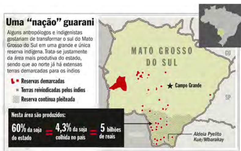
Figura 3: Mapa de demarcações em MS segundo Veja, edição de 04/12/2012

O mesmo tipo de tratamento à luta indígena reverbera na imprensa nacional, como no caso da reportagem “A Ilusão de um Paraíso” da Revista Veja (04/11/2012), como parte de uma ofensiva após a causa Kaiowa e Guarani ter ganhado grande repercussão em distintos fóruns (incluindo midiáticos) e um enorme apoio da opinião pública nacional e internacional.