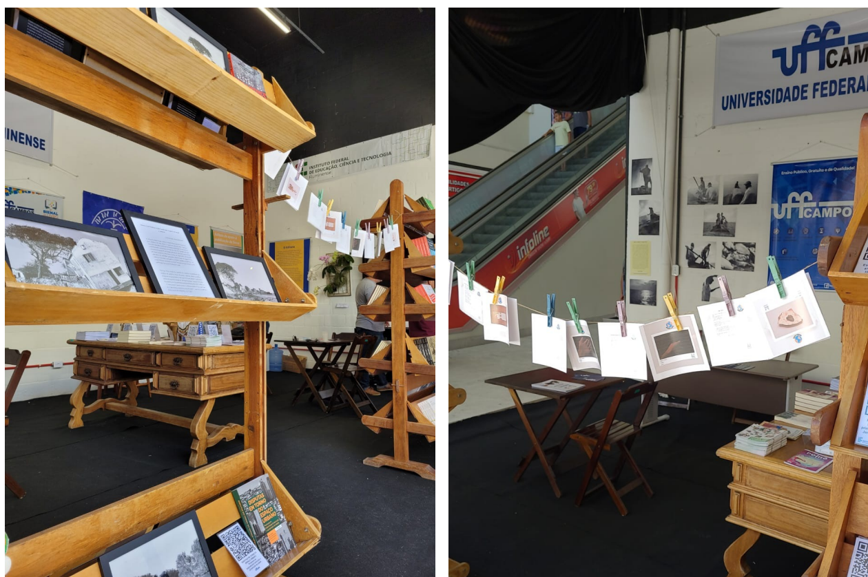
Figura 1 e 2. Stand da UFF na Bienal do Livro de Campos dos Goytacazes em 2022

A Revista Mundo Livre também marcou presença na 11ª Bienal do Livro de Campos dos Goytacazes , que aconteceu entre os dias 2 e 9 de novembro de 2022, no Guarus Plaza Shopping. O evento foi uma realização da Prefeitura Municipal de Campos dos Goytacazes, por meio da Fundação Cultural Jornalista Oswaldo Lima (FCJOL) e contou com a participação de entidades culturais, comerciais e literárias. Havia um espaço reservado para as instituições de ensino da cidade, entre as quais a UFF Campos (Figuras 1 e 2).