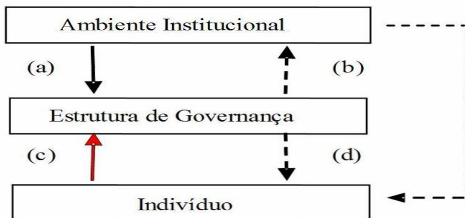
Figura 1: Esquema de Três Níveis

Fonte: FARINA, AZEVEDO, SAES (1997) conforme modelo de Williamson (1993)