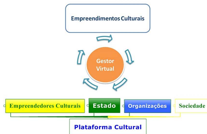
Figura 2 – Plataforma Virtual Lei Rouanet + Crowdfunding .