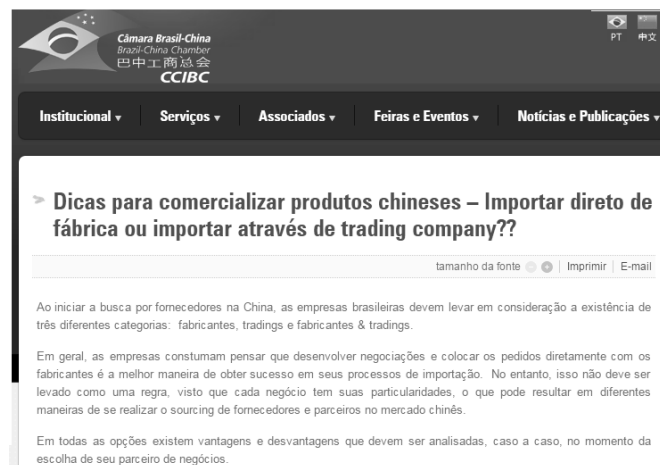
Figura 3 . Portal Câmara Brasil China

- Eu que agradeço, logo te enviarei um e-mail com um resumo de tudo que conversamos. Vou te mandar também o endereço de um portal explicativo (figura 3) para as transações.