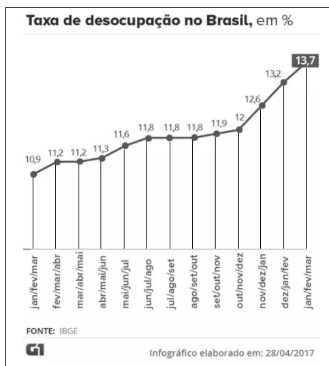
Figura 1 . Perspectiva de Desemprego no Brasil

Fonte: SILVEIRA, CAVALLINI (2017), IBGE (2017)