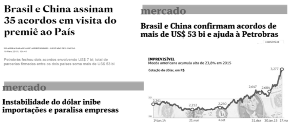
Figura 4 . Informações sobre comércio Brasil China