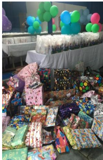
Figura 4 — Doação de brinquedos para creche

As campanhas também alegraram as crianças de uma creche, com a entrega de lanches e brinquedos, conforme ilustra a Figura 3, a seguir, em comemoração ao Dia das Crianças. Com o grupo, vivenciei o alcance de ações que, sozinha, não conseguiria realizar, mas, quando unimos as forças, fizemos coisas que nem imaginávamos ser possíveis de serem feitas.