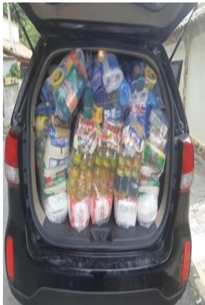
Figura 3 — Campanha das cestas básicas