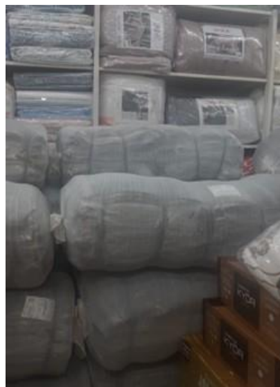
Figura 2 — Campanha dos cobertores

roupas para vestir os necessitados e chinelos para calçar os que, em noites frias, pisavam o chão gelado das ruas escuras e sujas. No mais, foram produzidas quentinhas para minimizar a fome e permitir um novo dia com outras oportunidades. As Figuras 2 e 3, dispostas a seguir, apresentam, respectivamente, a campanha dos cobertores e a das cestas básicas.