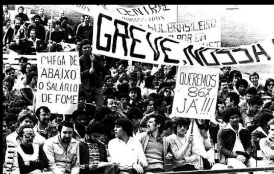
"MOVIMENTO OPERÁRIO NO BRASIL".