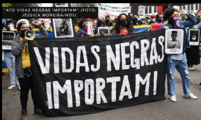
"ATO VIDAS NEGRAS IMPORTAM".

As variadas mudanças sociais e culturais a partir de 1960 resultaram na organização de movimentos sem a destruição ou alteração das relações de produção capitalistas como projeto político principal.