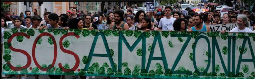
"AMAZÔNIA EM CHAMAS: ATOS EM BELÉM E EM MANAUS COBRAM AÇÕES DE BOLSONARO CONTRA AS QUEIMADAS NA FLORESTA".

AS SOCIEDADES NÃO SÃO HOMOGÊNEAS E PODEM SE DIVIDIR A PARTIR DE INTERESSES, HAVENDO RECONHECÍVEIS GRUPOS OPRESSORES E OPRIMIDOS.