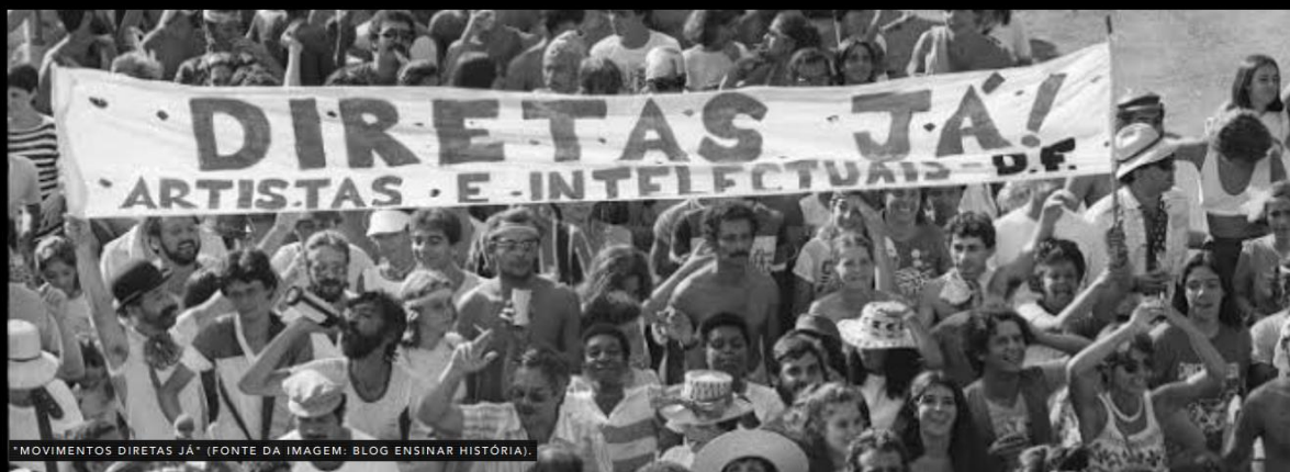
*MOVIMENTOS DIRETAS JÁ*.