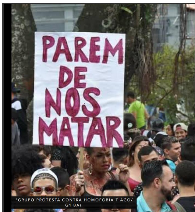
*GRUPO PROTESTA CONTRA HOMOFOBIA TIAGO/ G1 BA).