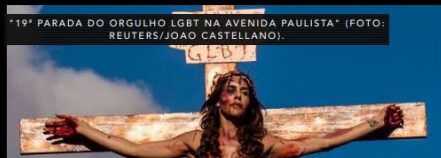
"19ª PARADA DO ORGULHO LGBT NA AVENIDA PAULISTA".