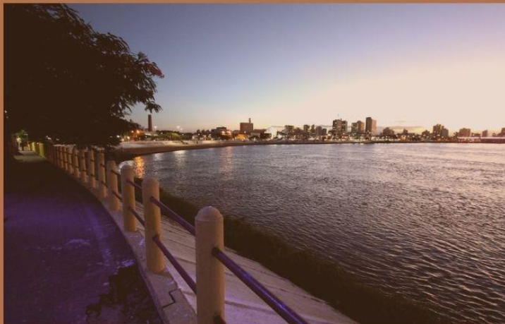
Campos dos goytacazes- Rio paraiba do Sul.

As ciências sociais analisam tanto o patrimônio material quanto o imaterial, considerando as transformações causadas pela modernização e a urbanização. Além disso, exploram os conflitos entre preservação e desenvolvimento, e o papel de diferentes atores na gestão do patrimônio, destacando sua relevância para o desenvolvimento local e o turismo cultural.