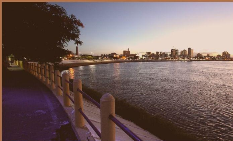
Campos dos goytacazes- Rio paraiba do Sul.

O patrimônio cultural de Campos dos Goytacazes é essencial para a construção da identidade local, sendo estudado pelas ciências sociais sob várias perspectivas. As tradições, práticas culturais, edificações históricas e festas populares refletem a memória coletiva e as dinâmicas sociais da cidade.